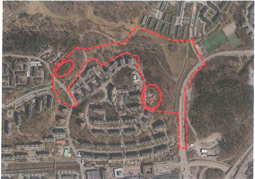
Ungefärligt planområde för Skärholmsdalen och aktuella platser för markanvisning.