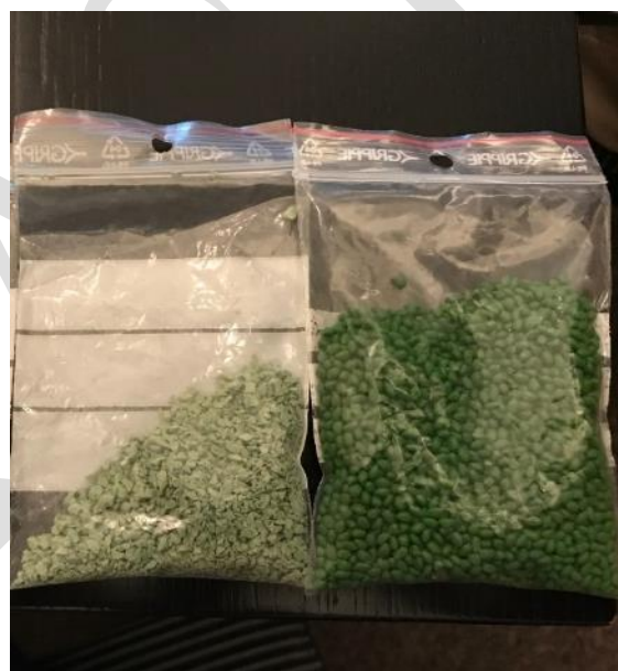
Plastpellets och gummigranulat är exempel på primär mikroplast.

Partiklarnas ursprung varierar och kategoriseras ofta som primär eller sekundär mikroplast. Primär mikroplast är avsiktligt producerade små plastpartiklar. Det kan vara plastpellets som används som råmaterial i plastindustrin eller skrubbmateriel i kosmetiska produkter, rengöringsmedel och läkemedel. Även granulat till allvädersplaner är exempel på primär mikroplast.