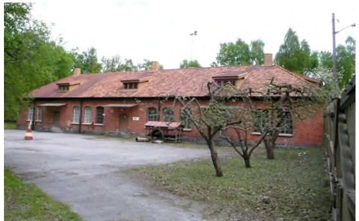
Befintlig byggnad entrésida