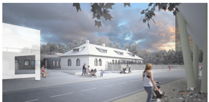
Vy från Gasverksvägen.