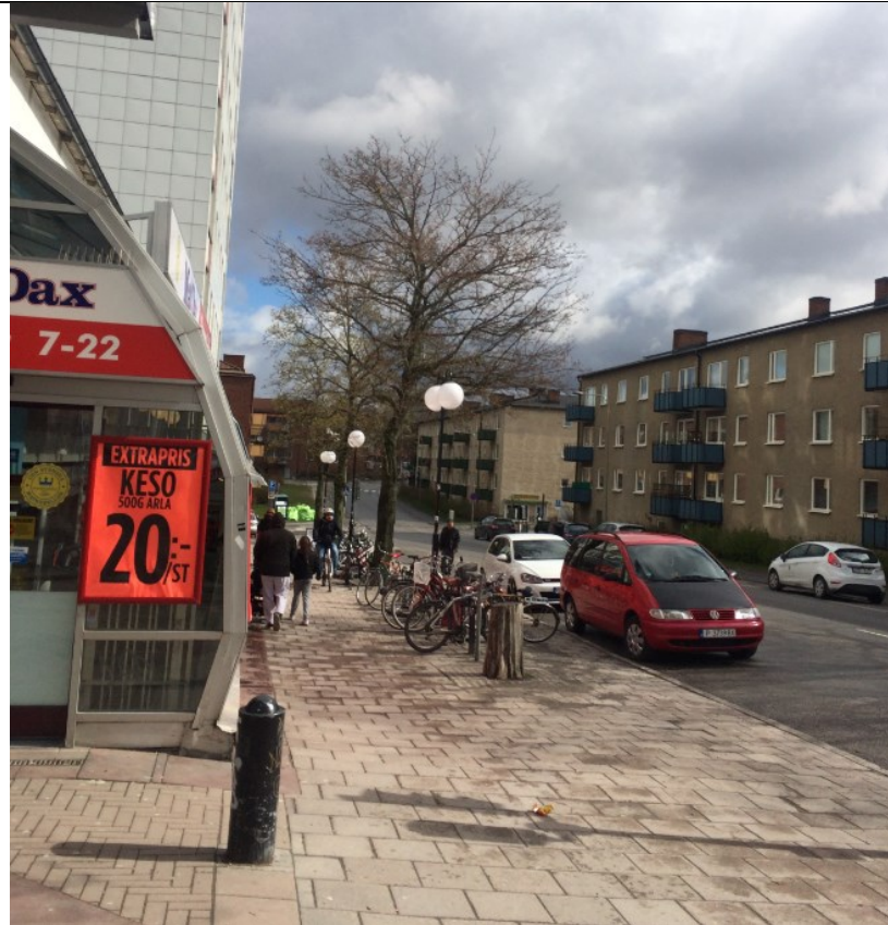
Trång gångväg & dött träd