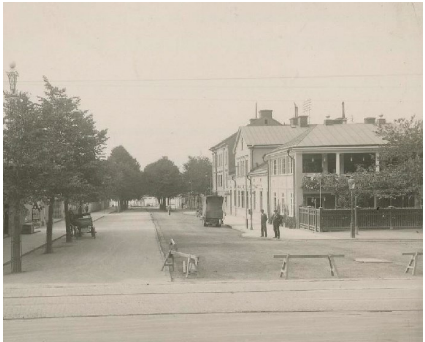
Fotografi strax efter uppförandet av sommarpaviljongen.

Restaurang Linden är en betydelsefull del av berättelsen om Södra Djurgårdens nöjesliv, och vittnar om en period då klassorienterad alkoholpolitik påverkade kroglivet i Stockholm. Stenhuset är därutöver den äldsta bevarade bolagsrestaurangen i Stockholm. Den tillbyggda sommarpaviljongen är med sin luftiga karaktär en värdefull representant för sommarrestaurangepoken på Djurgården. Förhållandet att en del av byggnadskomplexet, det vill säga Lindgården, tyvärr redan har rivits, gör vidare att kvarvarande del får ett högre kulturhistoriskt värde och är känsligare för förändring.