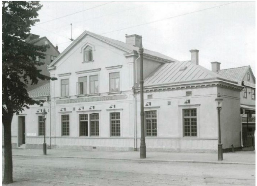
Restaurang Linden på 1920-talet.

Under slutet av 1920-talet får restaurang Linden en tillbyggnad i form av öppen veranda i två plan mot Djurgårdsvägen. Arkitekten, Arre Essén, stod även för ritningarna till den nya restaurang Lindgården. De uppfördes båda i en lätt arkitektur med klassicistiska drag, och inslag av funktionalism. Samtidigt byggdes Linden och Lindgården samman. Efter att Lindgården sedan revs 2011, för att ge plats åt Swedish Music Hall of Fame , har gårdsfasaden på Konsthallen 15 lagats provisoriskt. De båda byggnaderna på Konsthallen 15 har sedan uppförandet genomgått ett antal förändringar, som främst rört interiörerna samt verandadelens fönsterpartier.