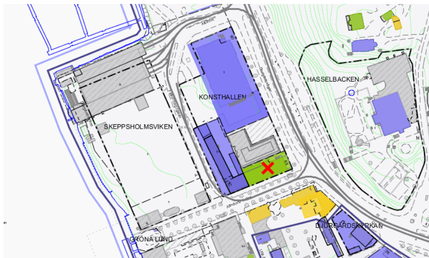
Utsnitt ur den kulturhistoriska klassificeringskartan (dpMap). Konsthallen 15 markerad med rött kryss.

Programmet syftar även till att pröva användningen hotellverksamhet med publika bottenvåningar, museum, restaurang och utbildning.