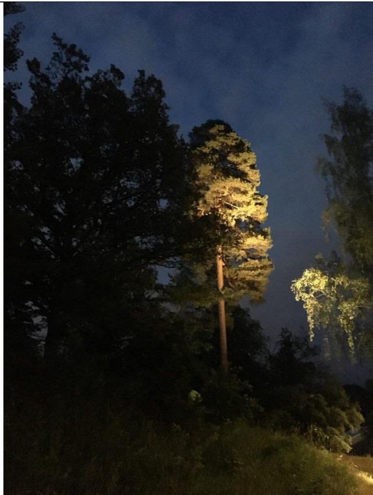
Bergsvägg i bergstoppen vid Kulans parklek.