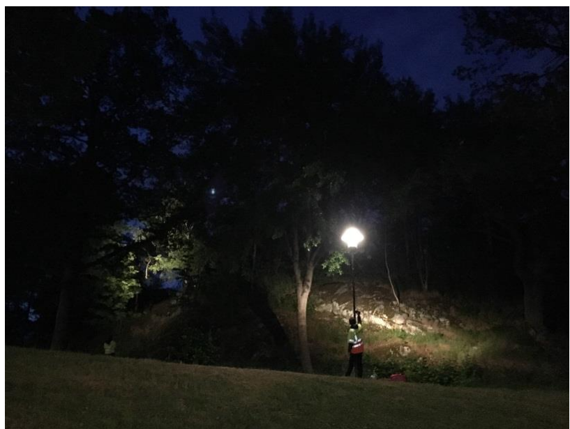
Tall vid sidan av gång och cykelvägen. Vårbergsplan.