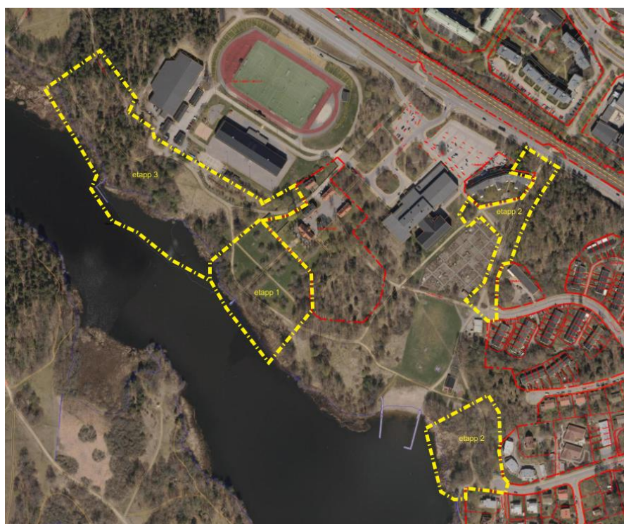
Etappindelning etapp ett till tre

Arbetet måste göras i etapper eftersom budgeten sträcker sig över flera år. En tänkt etappindelning är att börja med Farsta gård, fortsätta i etapp två med Trekanten och entrépartierna i norr och öster, och sedan i etapp tre med spontanidrottsytorna nedanför Farsta idrottsplats. Åtgärderna vid Pelousen föreslås i ett senare skede då ytterligare samordning med byggplaner och dagvattenhantering är nödvändig.