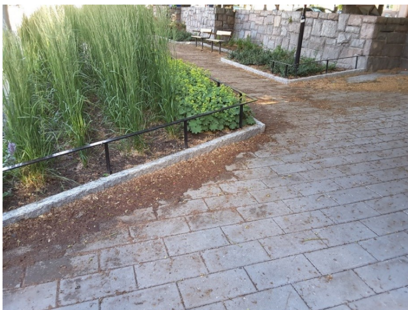
Bild 3. Exempel på ostädad yta.

Brister i städningen av omkringliggande ytor är ett återkommande problem och så var det även 2018. Tillsynen har genom åren fokuserat mycket på detta område. Brister i parkskötsel/städning i dammarnas närzoner diskuteras alltid vid den årliga höstkonferensen med stadsdelarna.