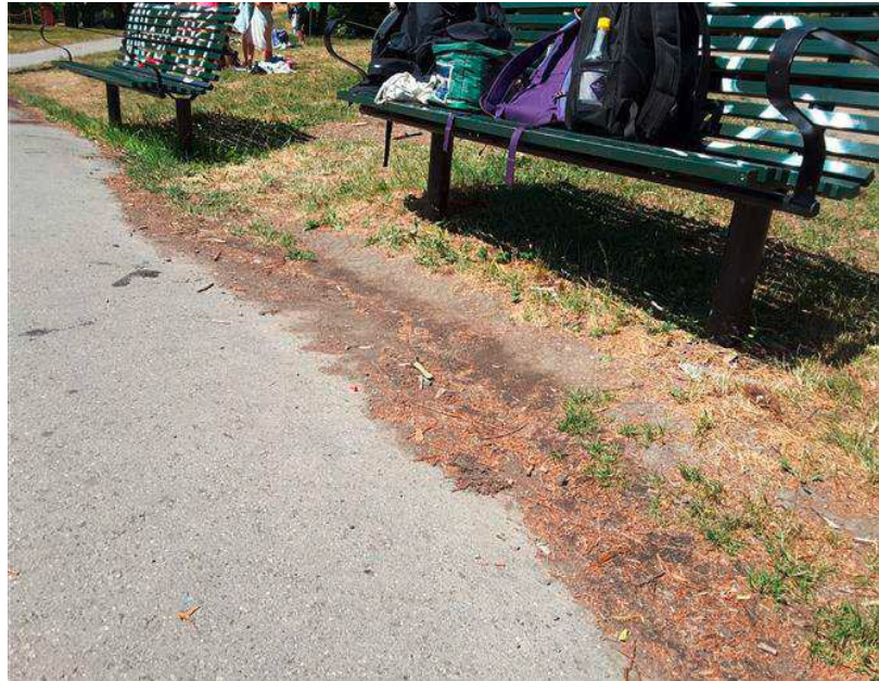
Bild 4. Ytterligare ett exempel på ostädad yta.

Varje plaskdamm ska ha en skylt uppsatt med information gällande förhållningsregler och kontaktuppgifter. Det noterades att flera av dammarna som inspekterades saknade skyltar. Detta kan dock delvis förklaras med att några av dammarna var nyrenoverade och inte hunnit få upp skyltar.