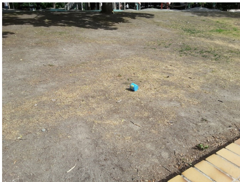
Bild 1. Exempel på slitna gräsyta.

Redan vid miljöförvaltningens inspektioner i början av juni var omkringliggande gräsytor väldigt torra och slitna till följd av det varma och torra vädret.