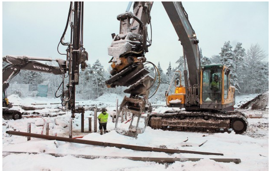
Bild 2. Pågående markarbeten

Sedan byggstart i augusti 2018 har arbetena i huvudsak bestått i markarbeten. Bland annat har den tidigare ispisten och markisoleringen demonterats och fraktats bort. Isoleringen visade sig innehålla miljöfarligt avfall vilken fick skickas på särskild deponi med förhöjd avgift. Marken består skiftande av såväl lera som berg och behöver pålas med cirka 300 stålplålar innan stommen kan resas under våren 2019. Konstruktionen består av en stålstomme med plåtsandwichväggar samt sadeltak.