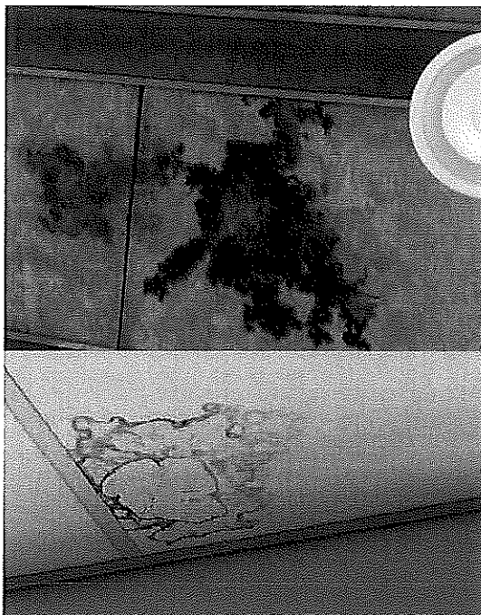
Figur 2 & 3. Exempel från tillsynen - Misstänka fuktskador i tak på en skola (fig. 2) och på en förskola (fig. 3).