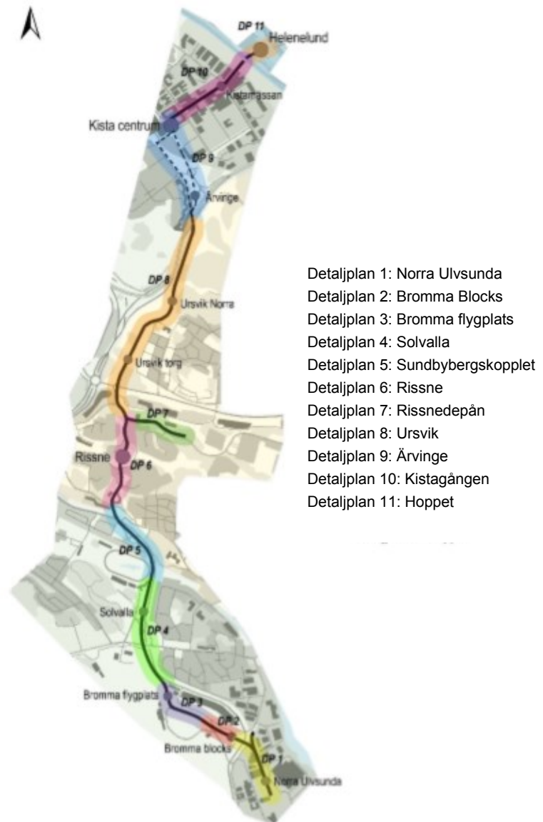
Bild 1. Kistagrenens detaljplaneindelning i Stockholm, Sundbyberg och Sollentuna