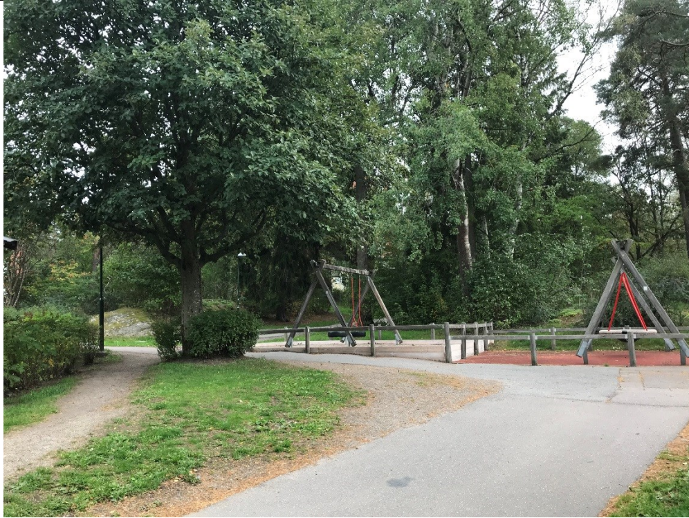
Nuvarande lekplats som ska byggas om med skogen bakom.