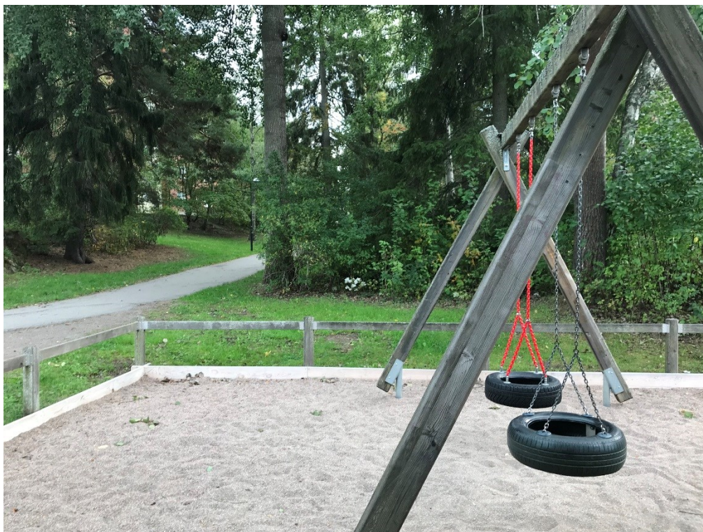
Nuvarande lekplats som ska byggas om med skogen bakom.

Med det här projektet hoppas förvaltningen att flickor och pojkar i närområdet gör sig bättre bekanta med skog och natur och därigenom associerar natur med något roligt och spännande och att det i sin tur gör att de känner sig tryggare i skogen i sin närmiljö. Vi tror även att föräldrar och andra närstående till barnen kommer att vistas i området tillsammans med barnen och får därmed en naturlig introduktion till skogen. Det kommer även leda till att platsen blir mer befolkad, vilket skapar en känsla av att vara sedd i området och därmed öka tryggheten.