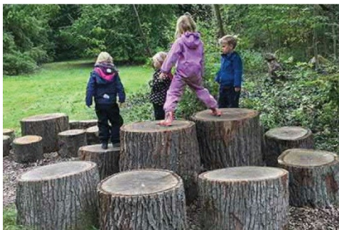
Exempel på vad som skulle kunna finnas att upptäcka i skogen.