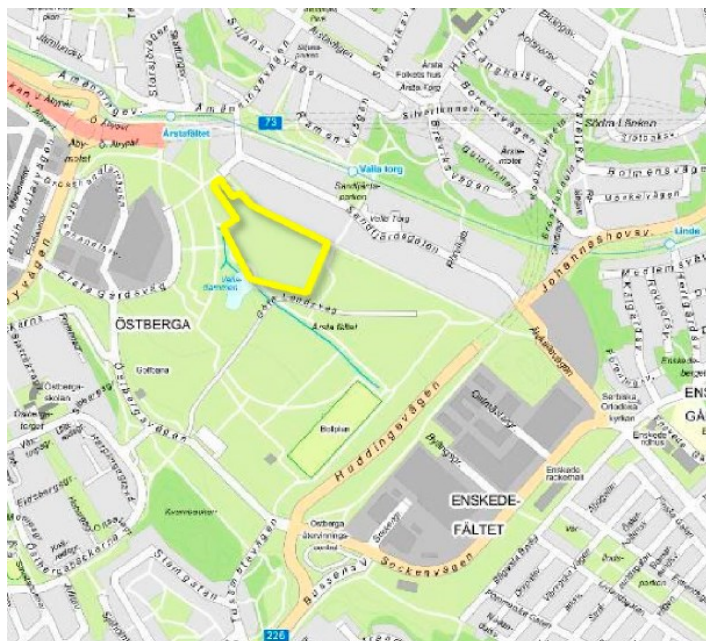
Årstafältet, etapp 1 markerat med gult