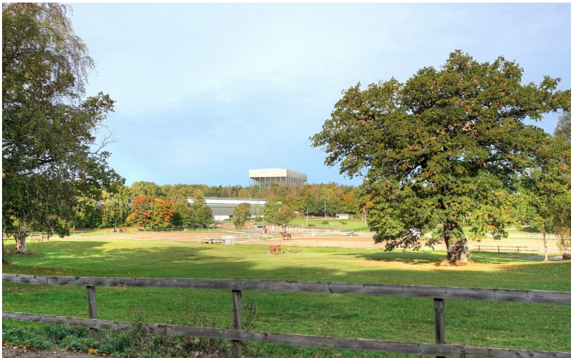
Fotomontage: Förslag till ny reservoar, sedd från ryttafältet.

Nedan framgår några bilder på hur den ombyggda reservoaren är tänkt att se ut när den är klar.