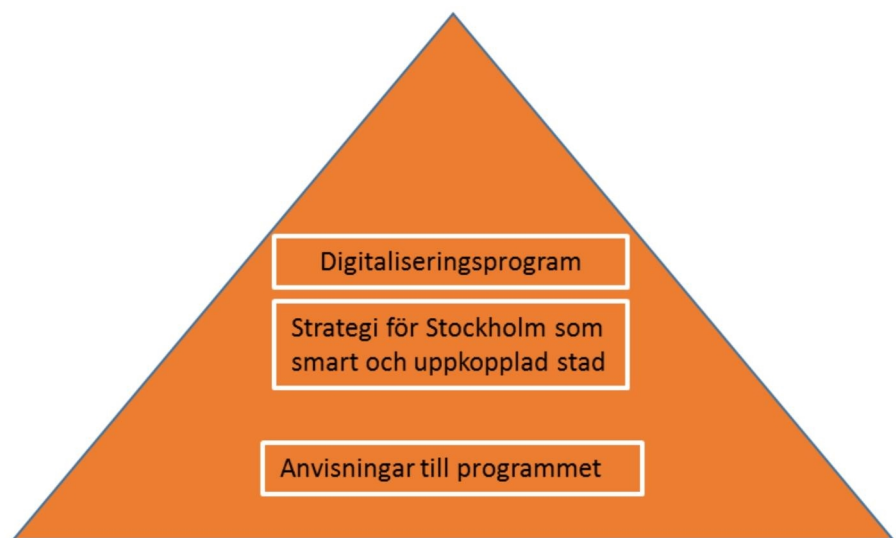
Figur 1: Digitaliseringsprogrammet är ett styrdokument med internt fokus. Strategi för Stockholm som smart och uppkopplad stad detaljerar målbilden och lägger grunden för genomförandet av stadens första stora initiativ som rör sakernas internet och användningen av stora datamängder. Anvisningarna förtydligar programmets innehåll och ger vägledning i hur programmet ska realiserars.

digitalisering och vidareutveckla den smarta staden. Strategin antar ett bredare perspektiv och involverar flera aktörer i regionen och ger tillsammans med digitaliseringsprogrammet en heltäckande beskrivning av stadens ambitioner och mål på digitaliseringsområdet.