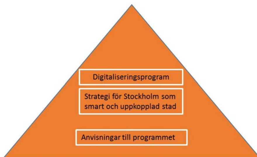
Figur 1: Digitaliseringsprogrammet är ett styrdokument med internt fokus. Strategi för Stockholm som smart och uppkopplad stad detaljerar målbilden och lägger grunden för genomförandet av stadens första stora initiativ som rör sakernas internet och användningen av stora datamängder. Anvisningarna förtydligar programmets innehåll och ger vägledning i hur programmet ska realiseras.

digitalisering och vidareutveckla den smarta staden. Strategin antar ett bredare perspektiv och involverar flera aktörer i regionen och ger tillsammans med digitaliseringsprogrammet en heltäckande beskrivning av stadens ambitioner och mål på digitaliseringsområdet.