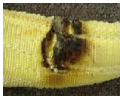
Smält eller brännmärken