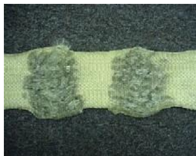
Revor / skadade band