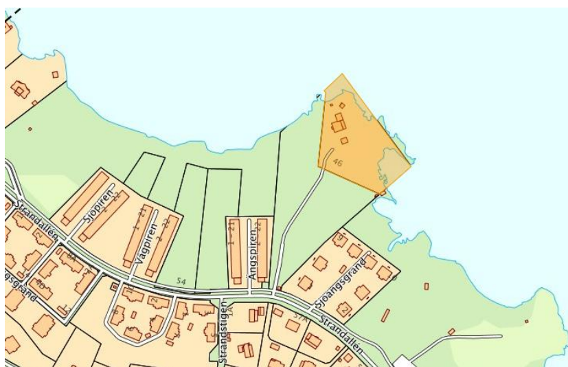
Fastighet Strand 1:6 markerat i orange.