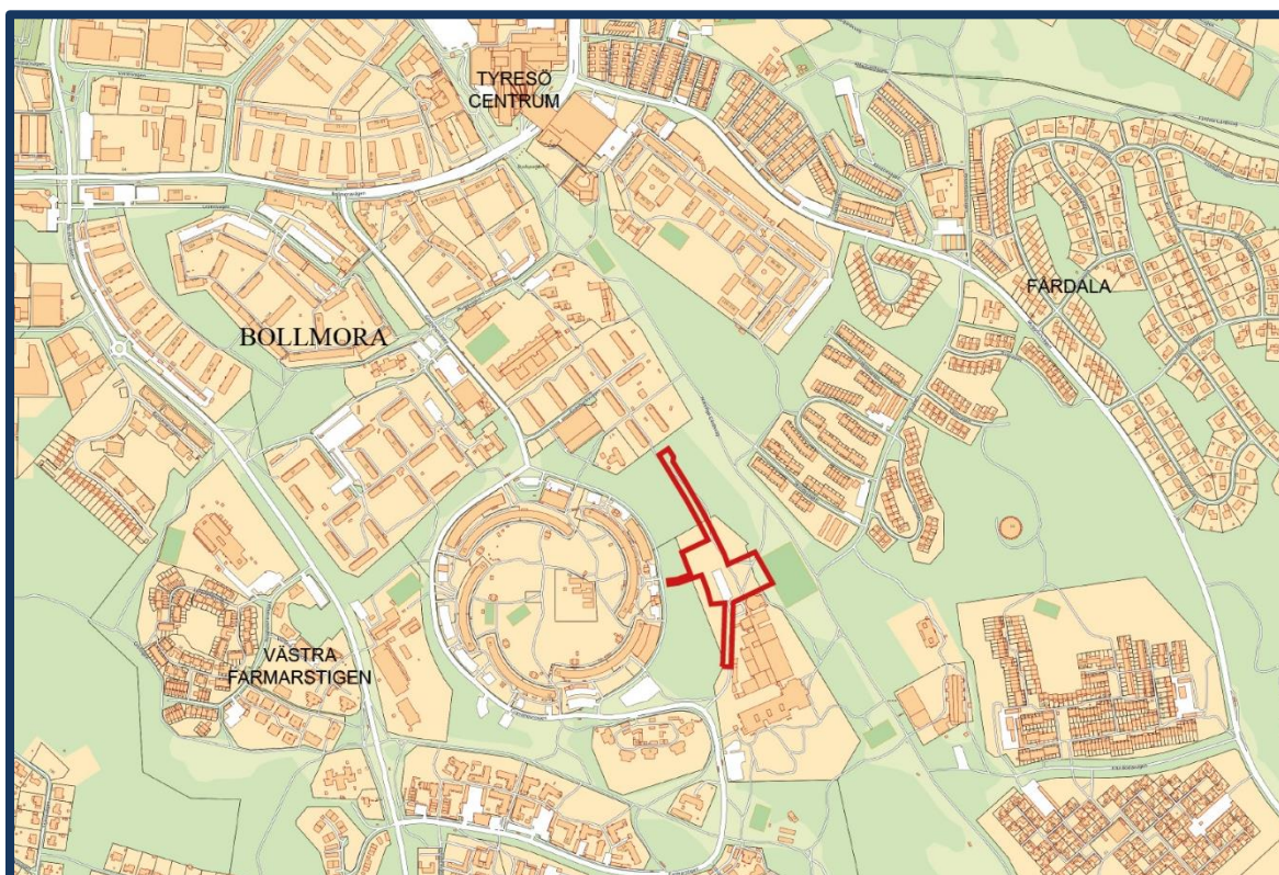
Karta som visar planområdet markerat i rött.

Del av fastigheterna Bollmora 2:1, Näsby 4:1367 och Näsby 4:1469 Inom Tyresö kommun, Stockholms län