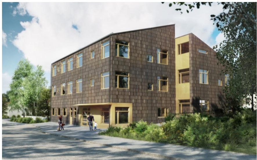
Förslag till ny förskolebyggnad längst Ripsavägen. Perspektiv från sydöst.

Den nya byggnaden uppförs i tre våningar mot Ripsavägen och i souterräng genom halvplansförskjutningar mot gården. Den nya förskolebyggnaden delas upp i två volymer som förskjuts i sidled för att ge intrycket av en mindre kompakt byggnadsvolym med uppbruten karaktär.