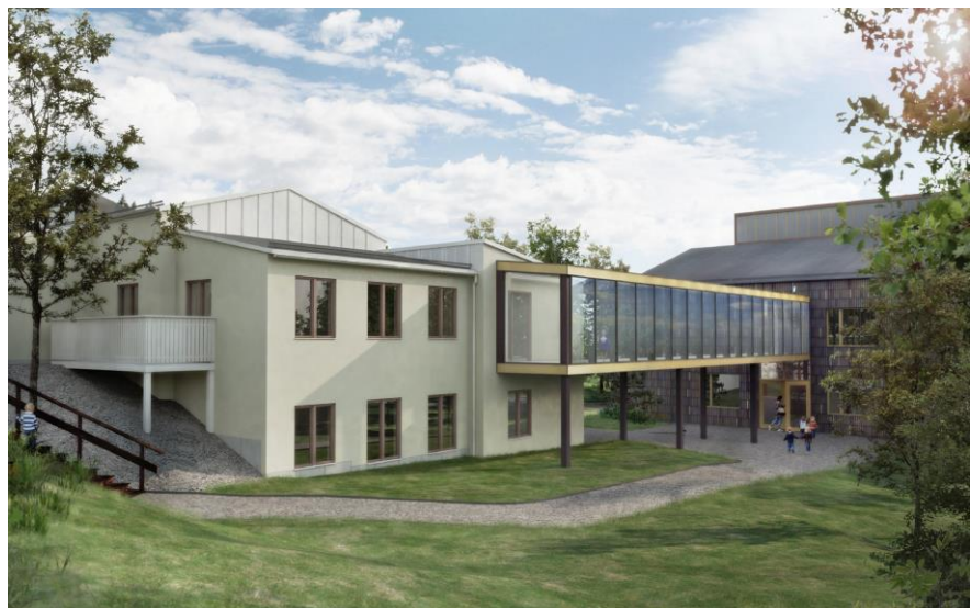
Gestaltning av förskolans två byggnader med förbindelselänk.

Förskolan får sammanlagt tio avdelningar med plats för 180 barn i funktionella och långsiktigt hållbara lokaler.