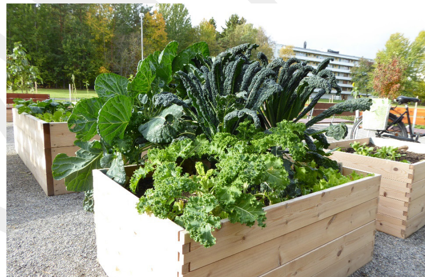
Kommunens odlingplatser «Odlas utan trädgård» integreras med sittplatser, grill och liknande, med förutsättningar för både aktiva och passiva möten.