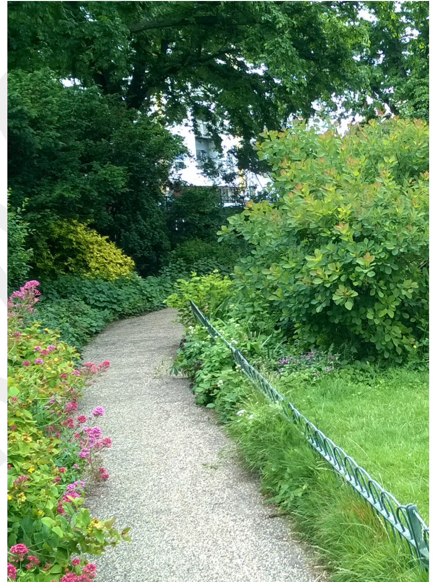
Illustration av ekosystemtjänster