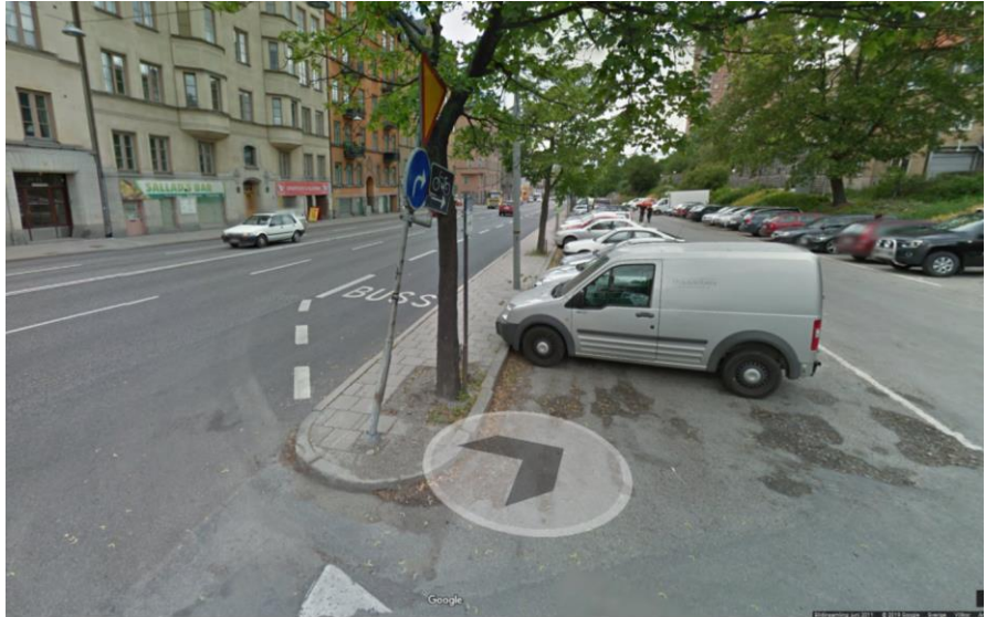
Figur 8. Förebild av parkeringsytan som senare byggs om till cykelbana. (Google)