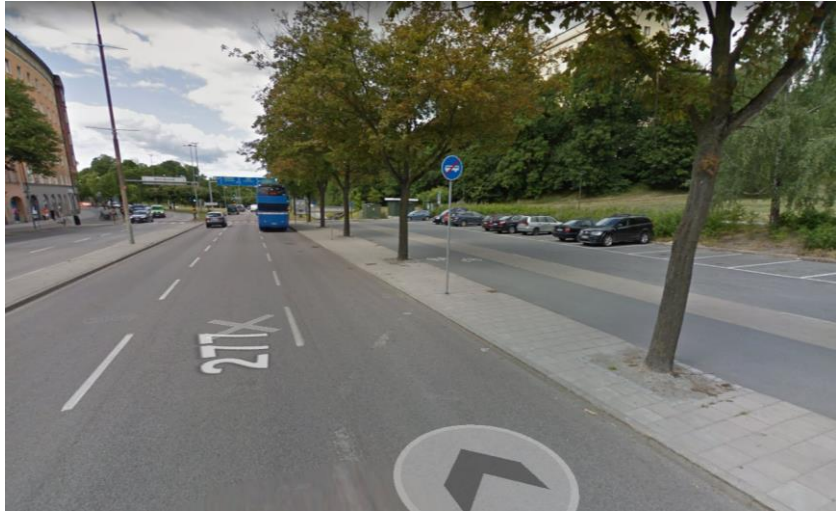
Figur 10. Förebild av sträckan där busshållplatsen senare kommer att anläggas.