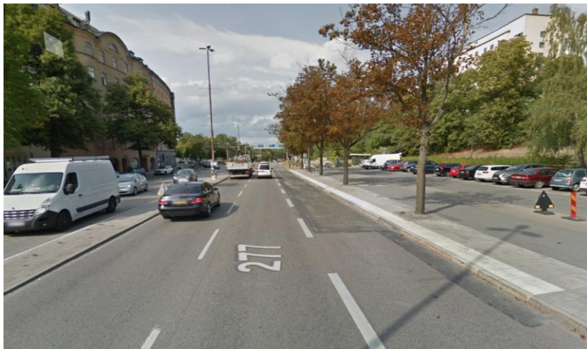
Figur 11. Efterbild av busshållplatsens nya läge, markeras av den vita plattraden. (Google).