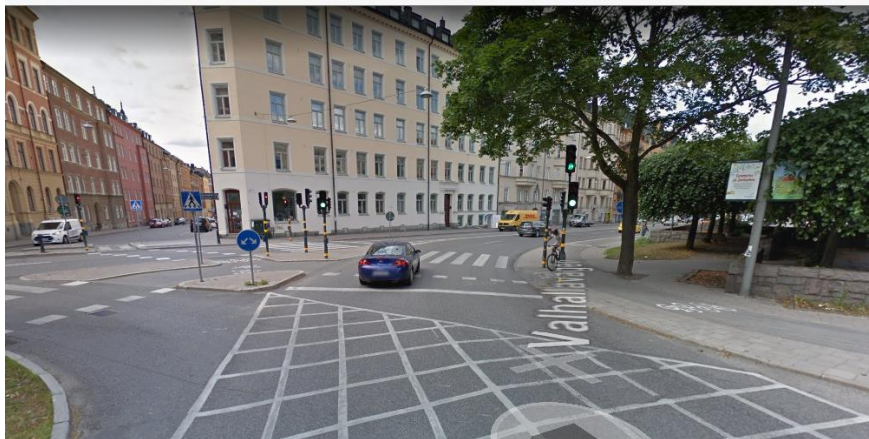
Figur 3. Förebild av korsningen.

Korsningen där Valhallavägen, Surbrunnsgatan och Körbärsvägen möts har byggts om från att ha två passager, via refug, varav en oreglerad till en sammanhängande signalreglerad passage.