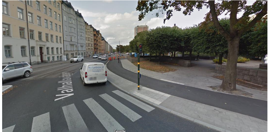
Figur 6. Efterbild av sträckan mellan Surbrunnsgatan och ner till parkeringsytan.

För att ge plats åt cykelbanan har 85 parkeringsplatser tagits bort på Valhallavägen mellan Surbrunnsgatan och Ingemarsgatan, se tvärsektionen (figur 7). Gående hänvisas, liksom tidigare, till parkeringsytan. Antalet in- och utfarter från parkeringsytan har minskats från tre till en och cykelbanan har vid in- och utfarten utförts som upphöjd och genomgående. Under byggtiden har cyklister och gående hänvisats till parkeringsytan.