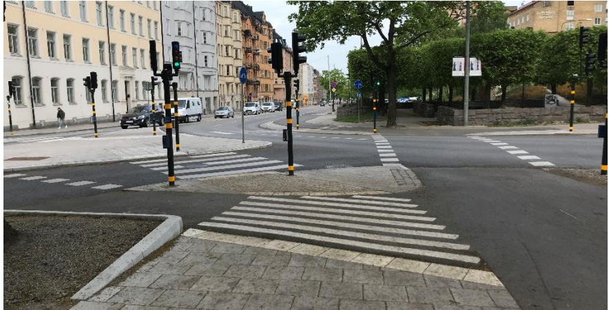
Figur 4. Efterbild av korsningen.

På sträckan mellan Surbrunnsgatan och ner till parkeringsytan har den befintliga cykelbanan breddats till 3,25 m. Avvikelser mot detta mått finns dock i korsningen mellan Valhallavägen, Surbrunnsgatan och Körbärsvägen där den nybyggda cykelbanan ansluter mot befintlig cykelbana från Körbärsvägen. Bredden på den befintliga cykelbanan är 2 m och bredden övergår på en sträcka av 25 m till en bredd om 3,25 m. Den lokala avvikelserna beror på att bredden på den nyanlagda cykelbanan behövt anpassas mot befintlig cykelbana, ett gatuträd som behållits samt att en uppsamlingsyta för gående anlagts mellan körbana och cykelbana. Cykelbanan uppfyller inte cykelplanens rekommenderade bredd på de 25 m som knyter ihop befintlig och nyanlagd cykelban.