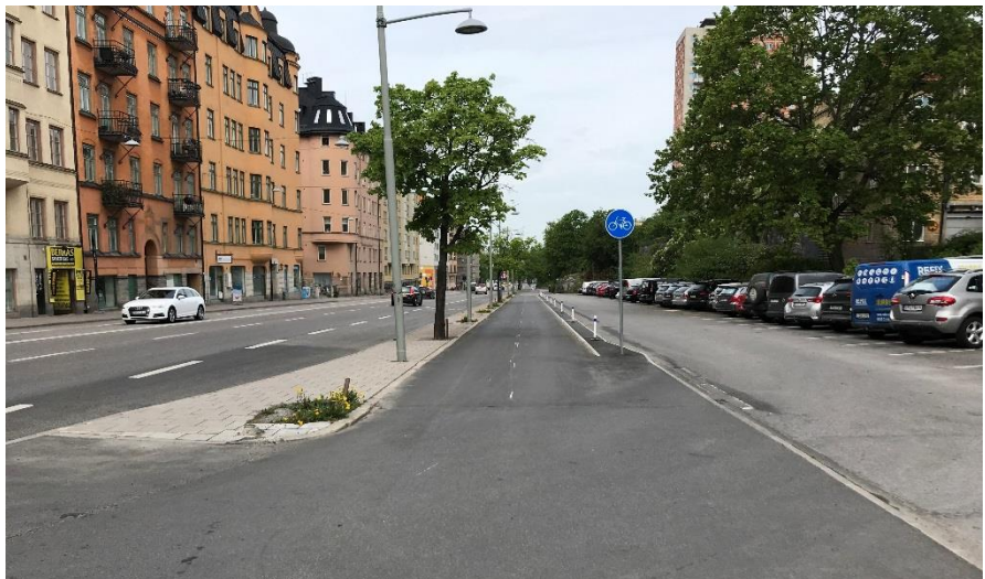
Figur 9. Efterbild av cykelbanan som anlagts på parkeringsytan.

Från parkeringsytan och norrut till Roslagstullsbacken har befintlig ficka för busshållplats tagits i anspråk för cykelbanan och busshållplatsen har flyttats längre norrut. Efter Roslagstullsbacken ansluter cykelbanan till befintligt cykelnät.