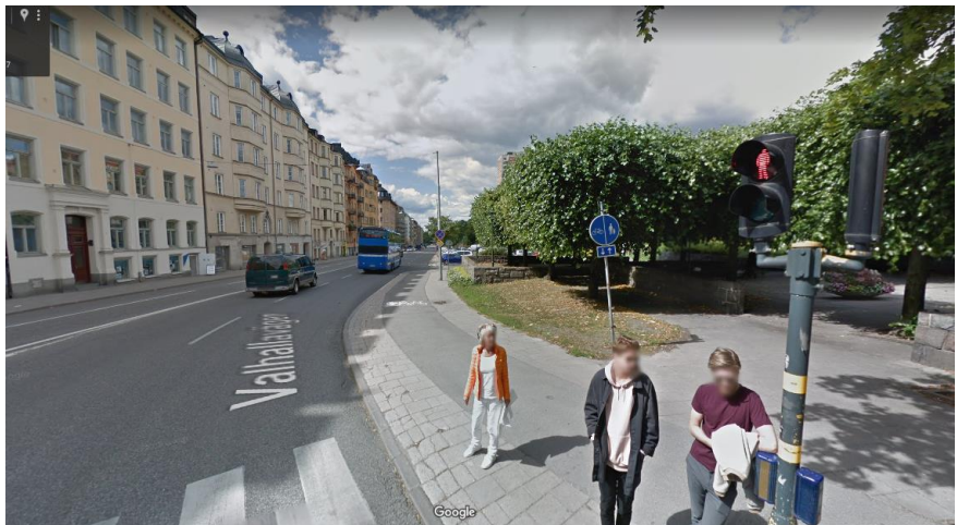
Figur 5. Förebild av sträckan mellan Surbrunnsgatan och ner till parkeringsytan. (Google).

På sträckan mellan Surbrunnsgatan och ner till parkeringsytan har den befintliga cykelbanan breddats till 3,25 m. Avvikelser mot detta mått finns dock i korsningen mellan Valhallavägen, Surbrunnsgatan och Körbärsvägen där den nybyggda cykelbanan ansluter mot befintlig cykelbana från Körbärsvägen. Bredden på den befintliga cykelbanan är 2 m och bredden övergår på en sträcka av 25 m till en bredd om 3,25 m. Den lokala avvikelserna beror på att bredden på den nyanlagda cykelbanan behövt anpassas mot befintlig cykelbana, ett gatuträd som behållits samt att en uppsamlingsyta för gående anlagts mellan körbana och cykelbana. Cykelbanan uppfyller inte cykelplanens rekommenderade bredd på de 25 m som knyter ihop befintlig och nyanlagd cykelban.