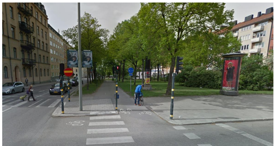
Figur 1. Förebild av gång och cykelbanan genom parken.

Från Odengatan och genom parken norrut till Surbrunnsgatan har befintligt gång- och cykelstråk breddats till 3,25 m. Den befintliga cykelbanan i korsningen Odengatan/ Valhallavägen har en bredd om 2 m. För att ansluta den nyanlagda cykelbanan har den nyanlagda cykelbanan smalnats av succesivt på en sträcka om ca 20 m, för få till en övergång mellan de olika bredderna. Till följd av detta uppfylls inte de rekommenderade måtten i cykelplanen på den anpassade sträckan i början av den nyanlagda cykelbanan genom parken.