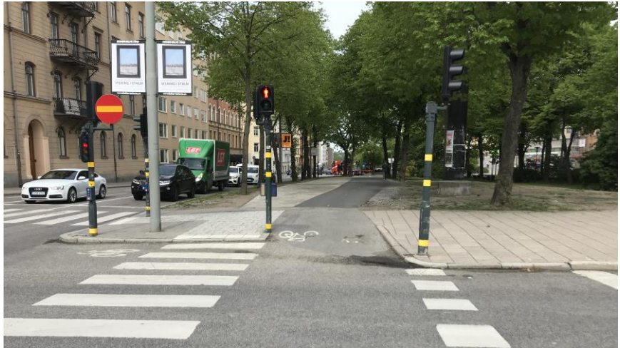
Figur 2. Efterbild av gång och cykelbanan genom parken.

Korsningen där Valhallavägen, Surbrunnsgatan och Körbärsvägen möts har byggts om från att ha två passager, via refug, varav en oreglerad till en sammanhängande signalreglerad passage.