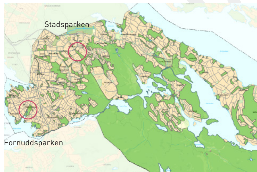
Tyresös två parker, kommunalparkerna Stadsparken och Fornuddsparken.

Tyresö kommun äger inte all mark inom kommunen och kan därför inte styra över alla park- och naturområden. Exempelvis ägs Tyresö slottspark av Nordiska museet. Även andra värdefulla grönytor i form av parker och närnatur finns inom privttägd mark, men har stor betydelse för den sammanhängande grönstrukturen.