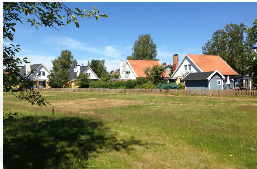
Planlagd parkyta med potential, i Lindalen.

Tyresö har i dagsläget ingen park som kan räknas som fickpark eller lokalpark, på grund av bristande innehåll, sociotopvärden, parkkaraktärer och skötsel. Stadsparken och Fornuddsparken är våra två kommunalpark. Kommunelarna Strand och Yttre Brevik, Dyviksudd, Vissvass och öarna saknar kommunalpark.