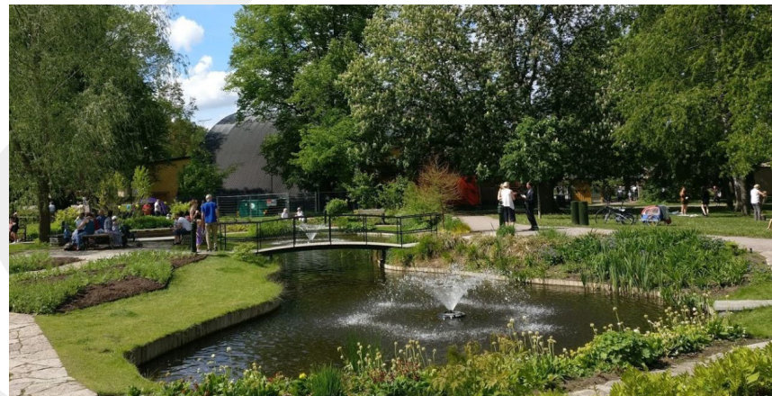
Högintensiv. Vattenkonst, perennplanteringar och stenläggningar i Uppsala Stadspark.

Skötselmoment: Klippning av gräsyta, kantskärning i materialmöten, etablerings- och underhållsbeskärning buskar och träd, ogrärensning, städning, tömning av papperskorg, underhåll av möbler, belysning och bryggor/spänger. Tillsyn fler gånger/år, vår- och höststäd.