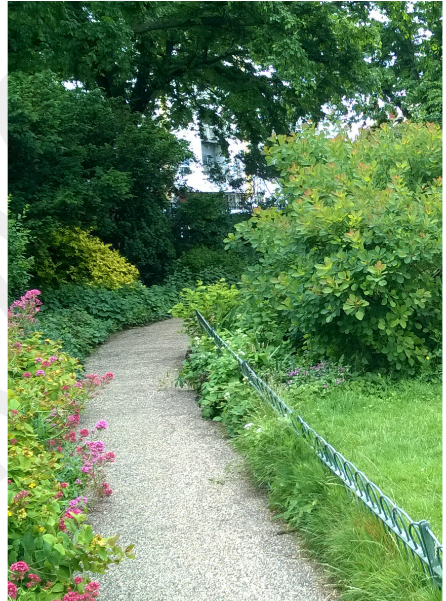
Illustration av ekosystemtjänster