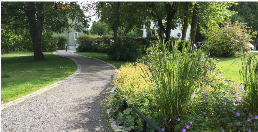
Medelintensiv. Materialmöten och perenner som kräver mer underhåll.