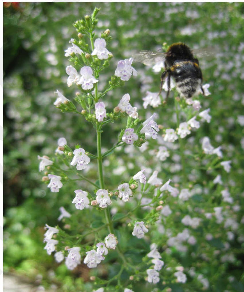
De återkommande mönster som finns i naturen har en förmåga att göra oss människor harmoniska, på grund av deras balanserade komplexitet.