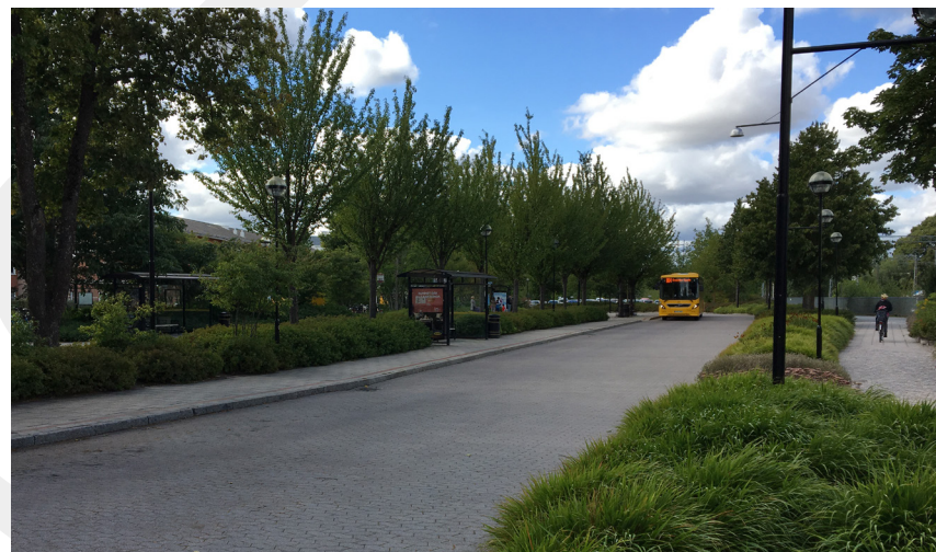
Grönskande vägmiljöer är en del av grönstrukturen.

En del av Tyresös grönområden ingår i Tyrestakilen, en av Stockholmsregionens fem gröna kilar. Det finns också en struktur med gröna kilar inom Tyresö, på kommunal nivå. De benämns i dokumentet som Farmarkilen, Wättingekilen, Petterbodakilen och Strand-Brevikskilen.