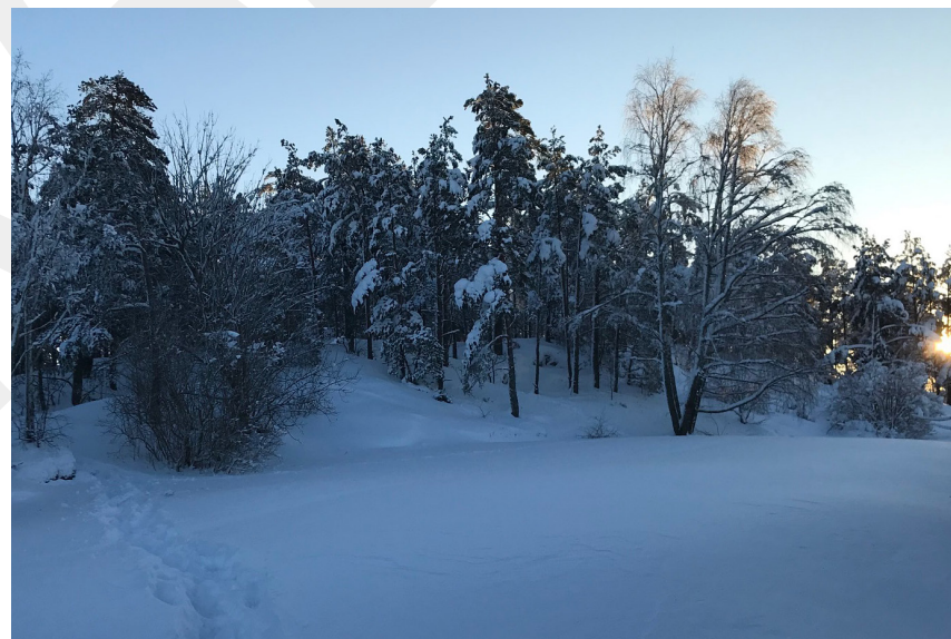
Närnatur i Krusboda.

Grönytor används som ett samlande begrepp för olika typer av parker och naturytor. Grönytor är inte hårdgjorda som exempelvis asfalt.