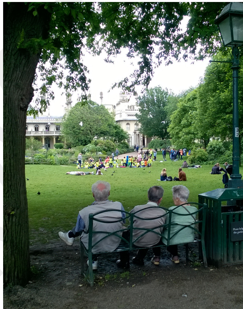
Parker som kan nyttjas på många olika sätt har goda förutsättningar att bli mötesplatser.

Barn som vistas mycket i naturen är ofta friskare, mindre stressade, har bättre motorik, högre koncentrationsförmåga och bättre minne. Forskningsresultat visar även att barn med stor tillgång till grönytor i högre grad utvecklar sin empati och kreativitet.