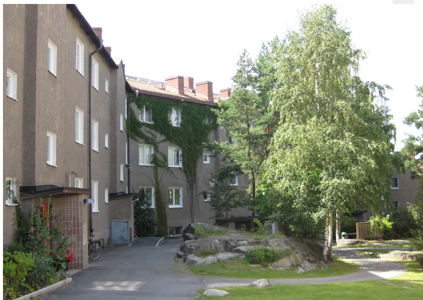
Vardagsgrönskan utanför bostaden.

Här förklaras de begrepp som används i dokumentet för att beskriva olika typer av gröna platser. För att kunna värdera och beskriva parker och andra grönytor används de vedertagna begreppen sociotopvärden och parkkaraktärer, såväl som ekosystemtjänster.