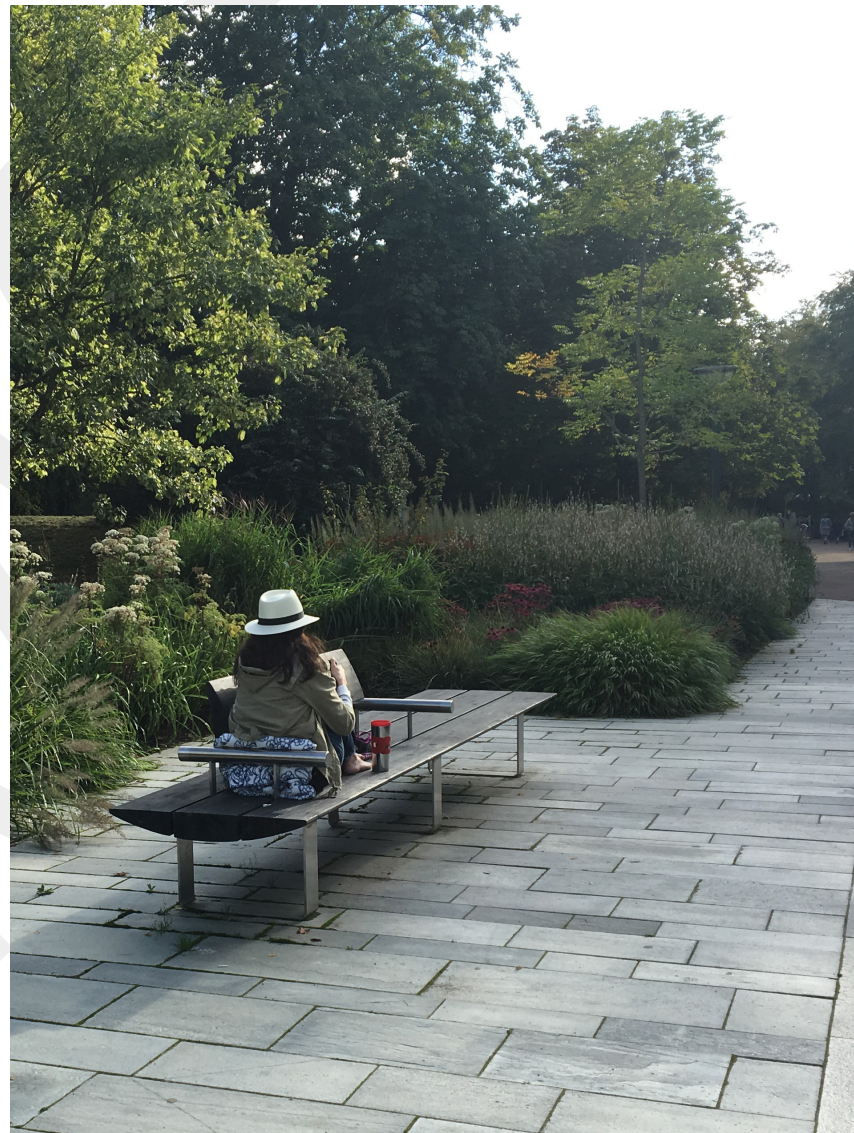
När parker och natur finns i vår närhet ökar chansen att de används som en naturlig del av vardagen.