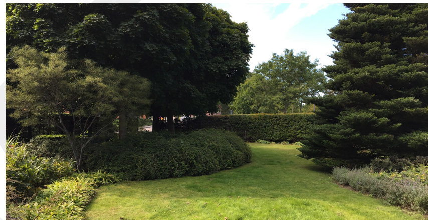
Lågintensiv. Exempel på en välgestaltad park som inte kräver intensivt underhåll.

Gestaltningen utgår alltid från vad som finns på platsen, som uppvuxna träd, topografi, mikroklimat mm och förstärks med exempelvis förändrade skötselåtgärder som uppstamning av träd för att förbättra sikt och ge ett nytt uttryck, komplettering av växtmaterial som buskar och solitärträd, förtydligande av entréer och nya sittplatser.