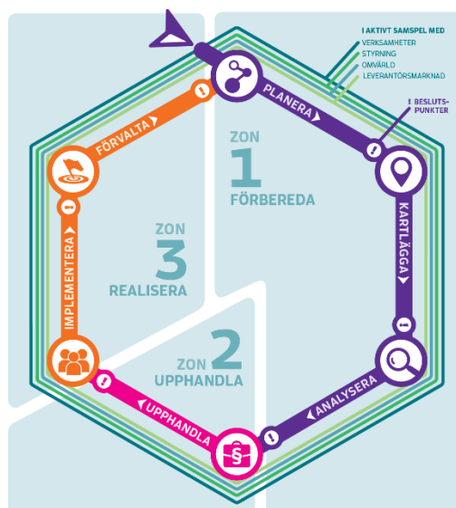
Figur 2 Upphandlingsmyndigheten

I programmets inledning (sid 3) betonas att kontinuerlig intern och extern samverkan är av största vikt för att nå stadens övergripande mål. Samverkan är av största vikt inom det kategoristyrda arbetssättet men det är också viktig som ett verktyg för att utveckla