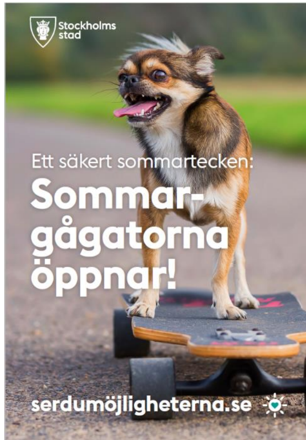
Bild från annonskampanj för Levande Stockholm 2019