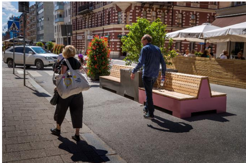
Nybrogatan under sommaren.

Nybrogatan har under sommaren 2019 varit sommargågata mellan Linnégatan och Karlavägen. Det är en utökning jämfört med året innan och sträckningen är nu två kvarter. Detta grundade sig i förslag från verksamheterna. Dialog med verksamheterna genomfördes innan införandet.