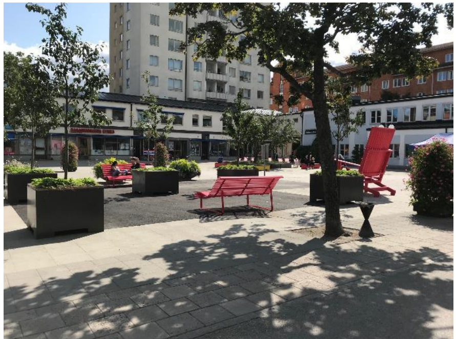
Bagarmossen (Lagaplan) under sommaren.

Bagarmossen (Lagaplan) genomfördes i samverkan med Skarpnäcks stadsdelsförvaltning. Olyckligtvis krockade ett arbete med torgets fontän med sommartorget. Efter denna miss har projektet arbetat med att säkerställa att samordningen på berörda platser ska fungera. Efter iordningsställande så blev dock utformningen lyckad. Kulturförvaltningen anordnade även kulturinslag på platsen.