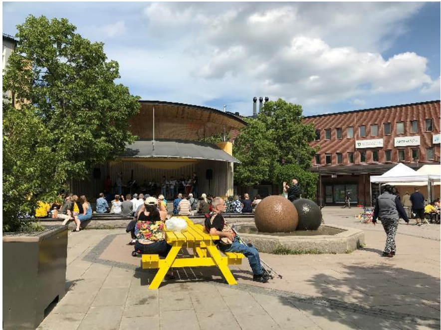
Hässelby torg under sommaren

Hässelby gårds torg genomfördes i samverkan med stadsdelsförvaltningen. Stadsdelen har sedan tidigare ett lyckat koncept med aktiviteter på torget. Kontoret möblerade och bidrog med kulturinslag.