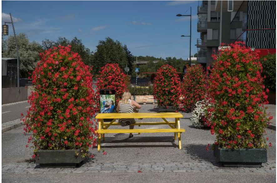
Hornsbergs strand under sommaren.

Humlegårdsgatan mellan Sturegatan-Brahegatan har under sommaren 2019 möblerats som en pop-up park av SEB Tryggliv. Nytt för 2019 var att det i år även fanns en yta för uteservering inom platsbildningen.