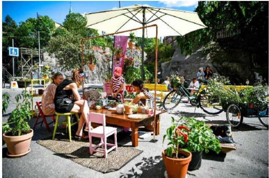
Odlingsworkshop på Skånegatan

Totalt antal aktiva besökare blev 1 495 st (exkl. invigningen), och en majoritet av besökarna var barn under 12 år. Flödet av förbipasserande har varierat stort, men uppskattningsvis har över 4 000 personer nåtts av program på platserna. Besöksantalet varierade främst beroende på platsernas naturliga flöden av förbipasserande, samt vädret.