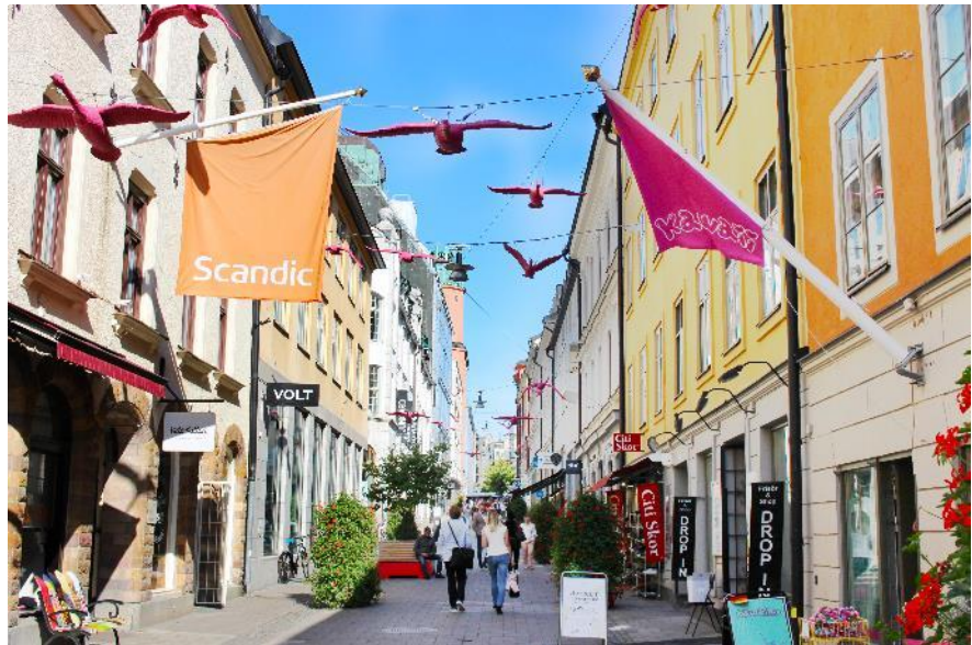
Gamla Brogatan under sommaren.

Gustav Adolfs Torg har en parkeringsplats direkt framför Operan vilken under sommaren 2019 möblerats av projektet i samarbete med Operan.