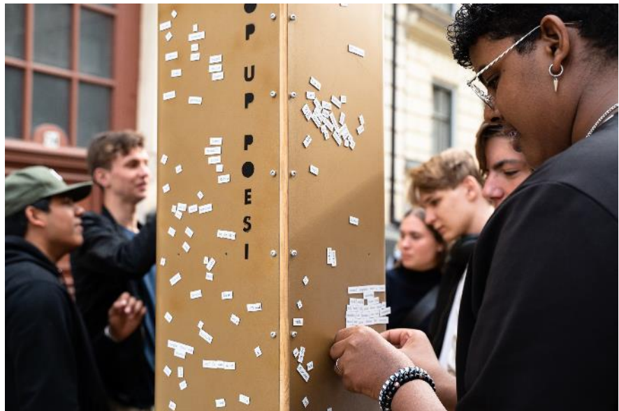
Pop-up poesi på Skånegatan.

Kontoret har även tillsammans med kulturförvaltningen arbetat med att erbjuda alternativa nöjen. Detta resulterade i ett antal evenemang vilka beskrivs mer nedan, bland annat en installation med pop-up poesi.