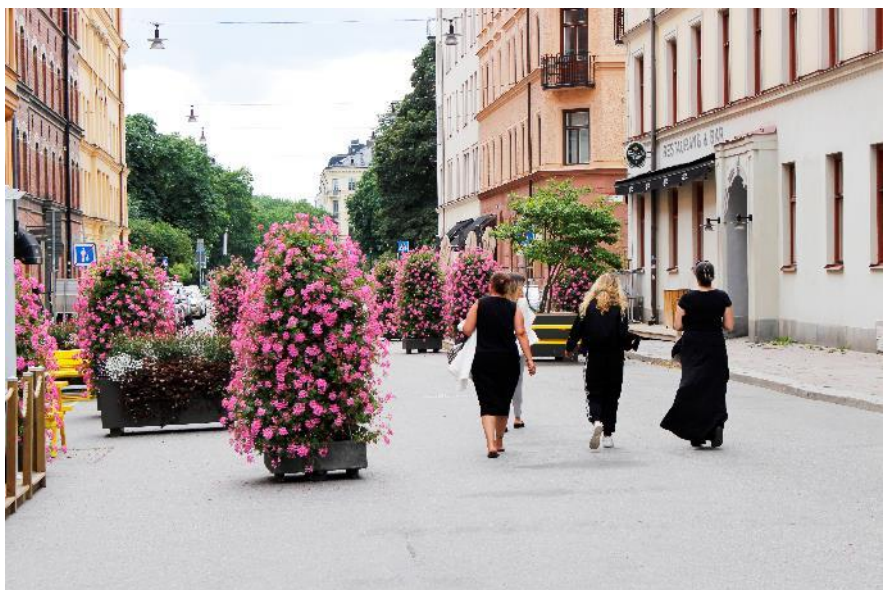
Norra Agnegatan under sommaren.

Norra Agnegatan har under sommaren 2019 varit sommargågata på den norra delen mellan Hjärnegatan och Fleminggatan. Nytt för i år var utplacering av spelbord då det efterfrågats av boende i området.