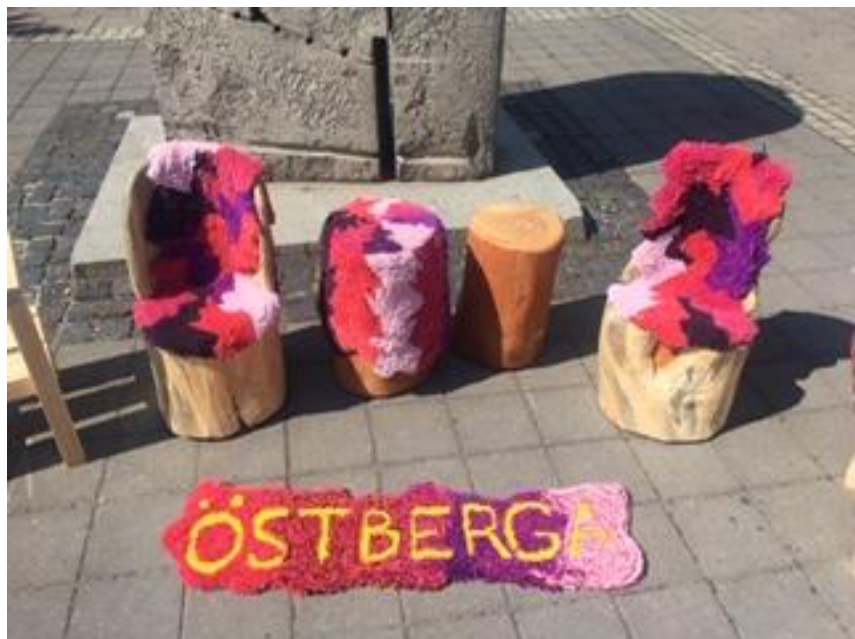
Resultat från sittskulpturer på Östberga torg