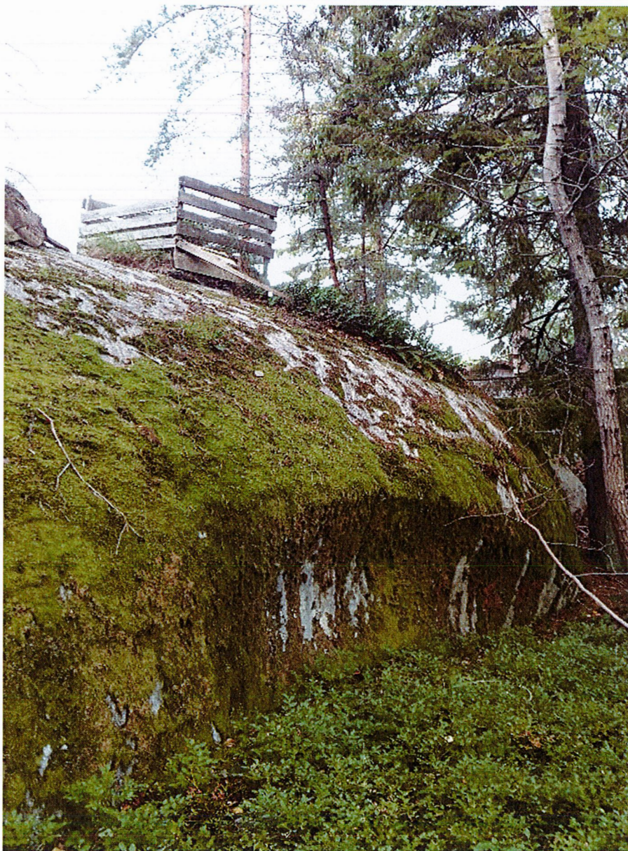
Del av bergsbranten bakom (öster om) fastighet Näsby 4:967, minst 4 meter

Genomförandetiden för planen har löpt ut vilket möjliggör en ändring av detaljplanen.