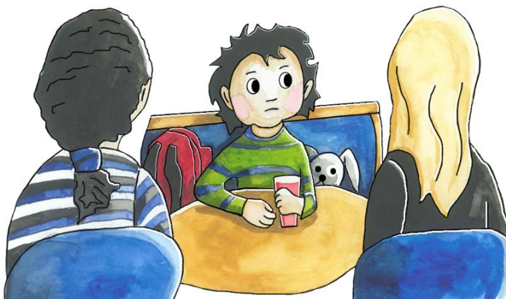
Illustration: Annelie Sjöberg

Inom ekonomiskt bistånd kan det således vara av vikt att i samband med en barnkonsekvensanalys väga in huruvida barnets egna åsikter och inställning med hänsyn till ålder och mognad bör ha för inverkan på analysen och således även bedömning och beslut. Denna bedömning bör göras oavsett om barnets åsikter och inställning inhämtats genom barnen själva eller genom föräldrarna.