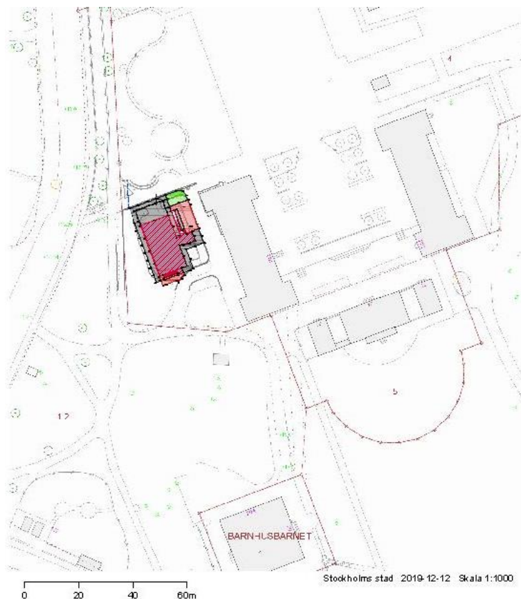
Bild 1. Situationsplan över Kristinebergsskolan med paviljong utmarkerad

Projektet omfattar inhyrning och etablering av en paviljonsbyggnad vid Kristinebergsskolan till höstterminen 2020. Paviljongen uppförs intill befintliga skolbyggnader på SISABs skolgårdsfastighet Kristinebergs Slott 4, och utgörs av två moduler i två våningar. Valet av paviljongmodell är gjort utifrån platsens förutsättningar.