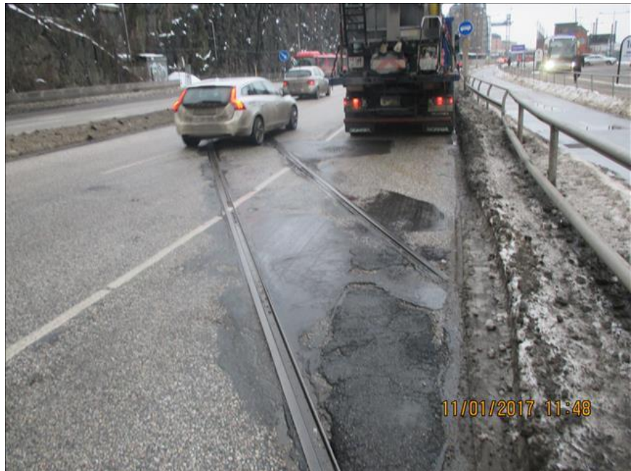
Bild 3 Temporära lagningar och spårbildning vid Stadsgårdsleden.