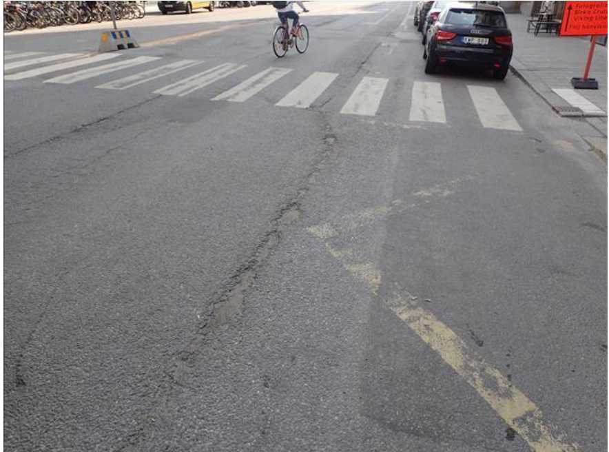
Bild 2. Sprickbildningar och skadad beläggning längs med Katarinavägen

Förstärkningsåtgärderna innebär att ny asfaltering av gatorna utförs. Arbetena utförs nattetid för att minimera arbetenas påverkan på framkomligheten.