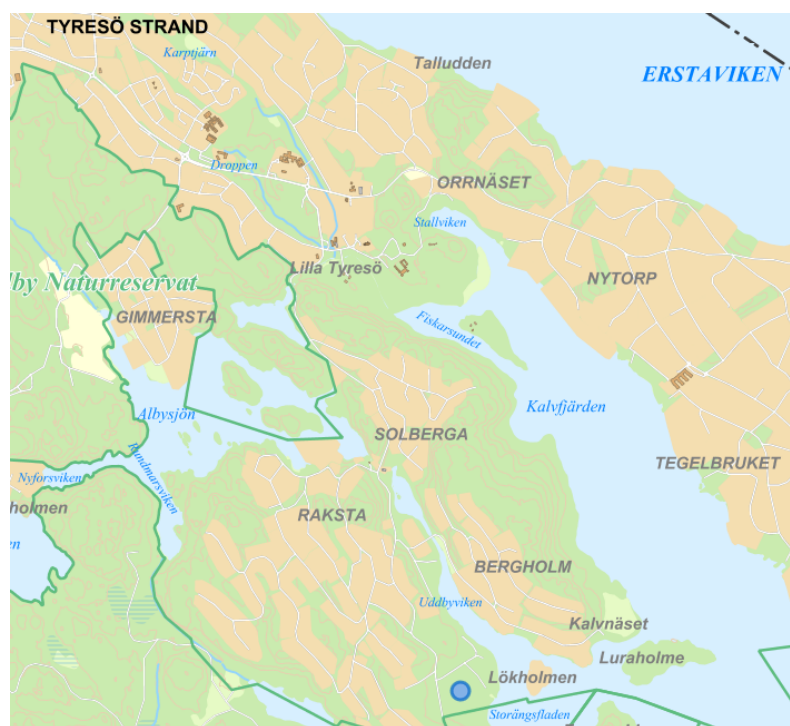
Östra Storängen vid blå punkt.