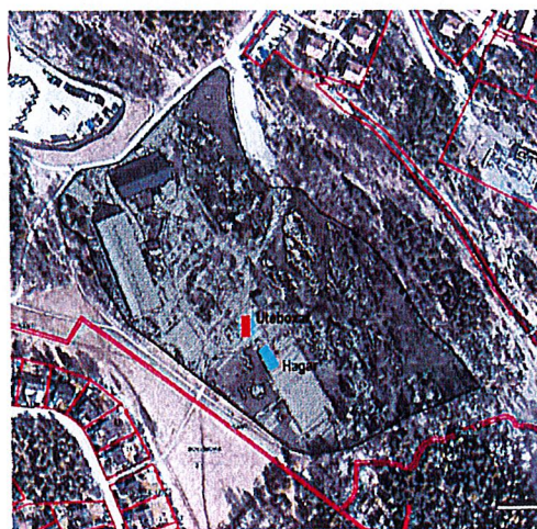
Placering inom fastighetsgränsen (streckad linje)