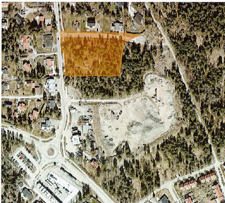
Strand 1:114, är markerad med orange.

Fastigheten Strand 1:114 (Strandallén 10) är i kommunal ägo, på fastigheten finns flera byggnader. Byggnaderna på fastigheten består av en äldre sommarstuga inklusive några uthus med därtill hörande standard. Kommunen har en hyresgäst på fastigheten. Fastigheten förvärvades av kommunen som ett strategiskt markförvärv för att genomföra Trädgårdsstaden etapp 3. I samband med framtida planläggning kommer markanvändningen ändras.