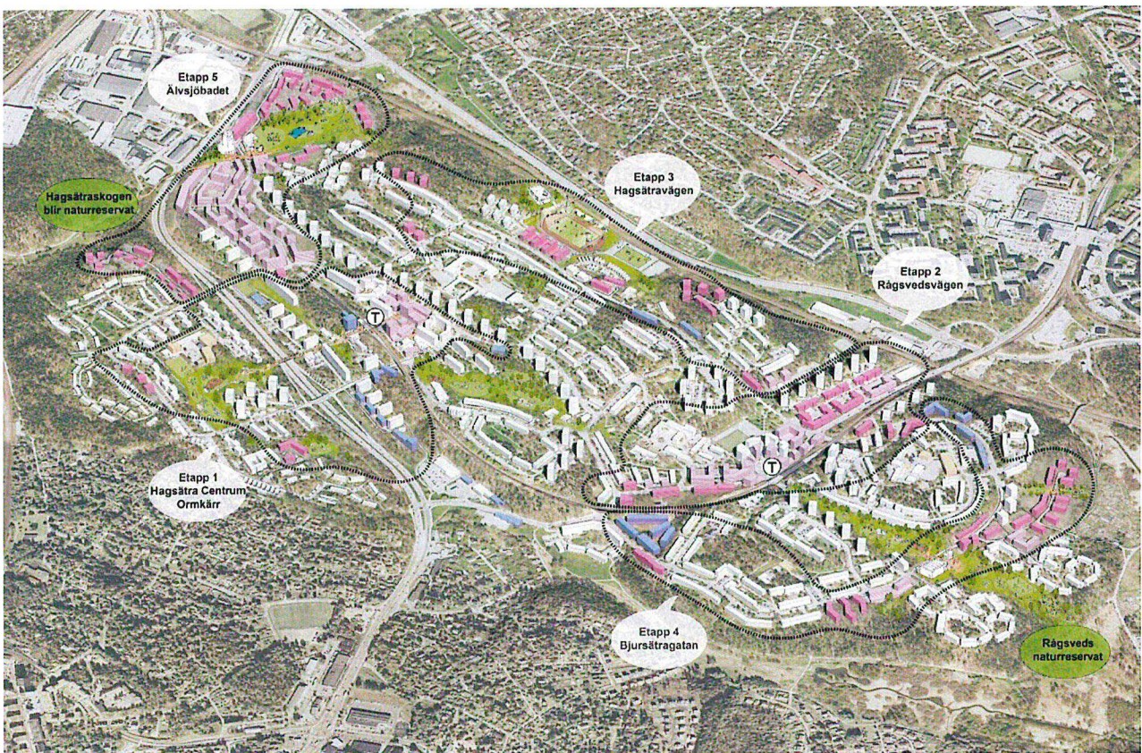
Bild: Översiktsillustration Fokus Hagsätra-Rågsved. Blå byggnader visar pågående projekt.

Kontoren föreslår vissa revideringar utifrån samrådssynpunkterna, områdets ekologiska kärnvärden samt att det i planeringen för Fokus Hagsätra Rågsved framkommit vikten av att stärka både rekreativa samband och spridningssamband samtidigt som relativt omfattande ny bebyggelse möjliggörs i andra gröna samband.