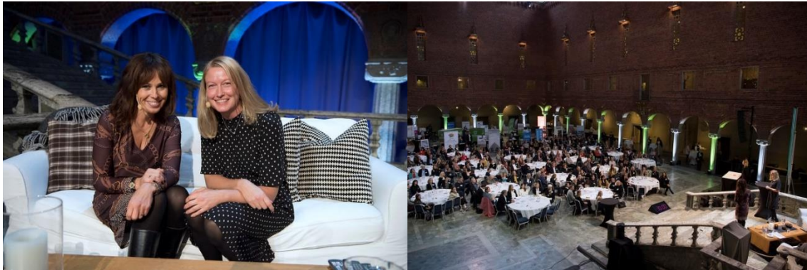
Klimatpaktskonferens i Stockholms stadshus, den 15 oktober 2019.

Klimatpakten är ett samarbete mellan Stockholms stad och företag och organisationer som vill minska sin klimatpåverkan. Nätverket startade 2007 med fem företag. Idag har nätverket 290 medlemmar från hela Stockholmsregionen. Mer information: foretagsservice.stockholm/klimatpakten