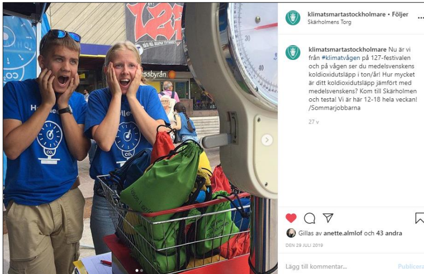
Instagram-inlägg under Klimatvågens sommarturné