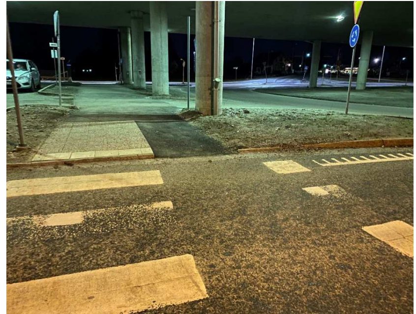
Efter (kompletteringsmålning kvarstår)