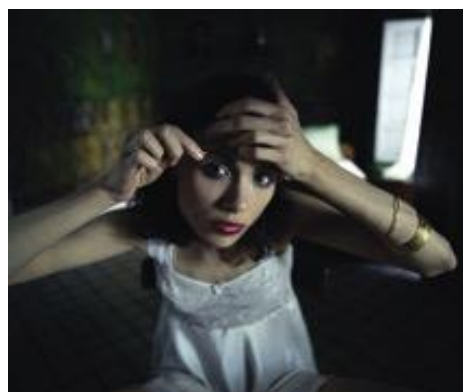
Bild 1. Ny regional utvecklingsplan (RUF). Beställare: Stockholms Regionplanekontor och kulturförvaltningen i Stockholms läns landsting. Projektledning: AM Public. Bild 2. Shirin Neshat, ur "Zarin", Stockholm konst vid GATE – Greenland Park Art and Technology event i Kista. Beställare: Stockholms stad m.fl. Projektledning: AM Public.