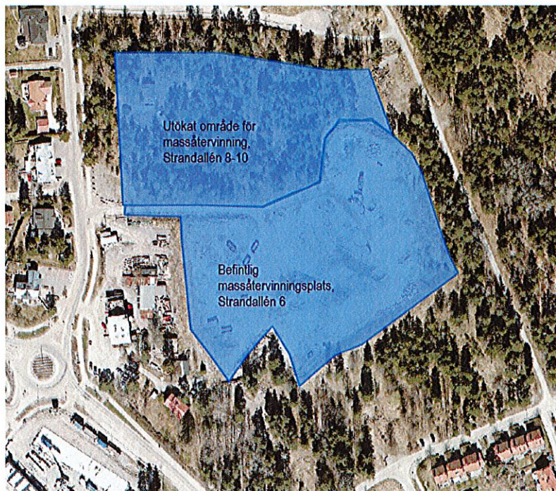
Massåtervinningsplats vid Strandallén, befintlig och utökad yta markerad med blått.

I augusti 2019 gavs kommundirektören uppdraget att upprätta en handlingsplan för genomförande av strategi för lokal masshantering på Östra Tyresö (KSM2019-833-260). Som en del av uppdraget ingick att ta fram en lokaliseringsutredning rörande massåtervinning på Strandallén 6 (Strand 1:390 m.fl.) samt på Strandallén 8- 12 (Strand 1:112 m.fl.). Även fastigheterna vid Slumnäsvägen 19-23 berörs och tas med i utredningen.