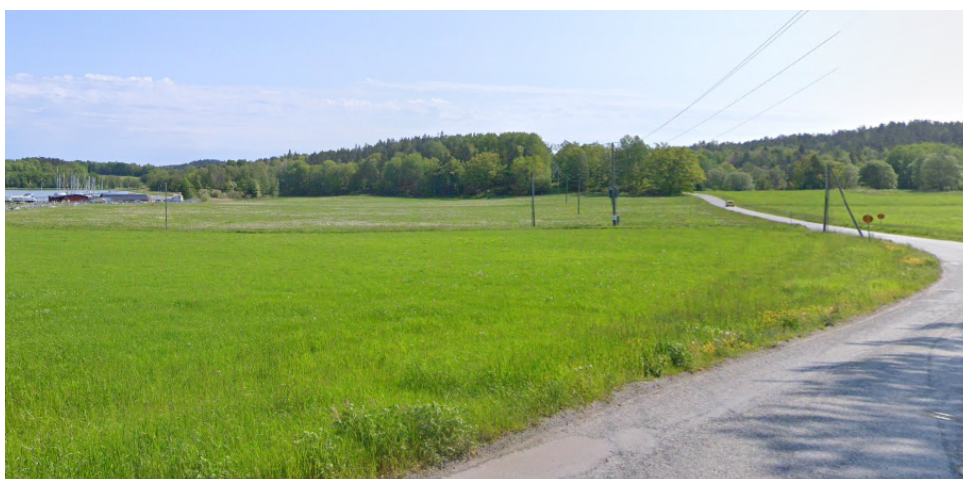
Jordbruks- och kulturlandskapet

Östra Storängen ligger avskild i jordbruks- och kulturlandskapet söder om Raksta intill Storängsfladen och Kalvfjärden. Platsen gränsar till Tyresta naturreservat och ligger delvis inom riksintresse för naturvård. Sedan många år tillbaka arrenderas marken av Uddby gård som använder marken för foderodling. Ny arrendator tillträdde 2016.