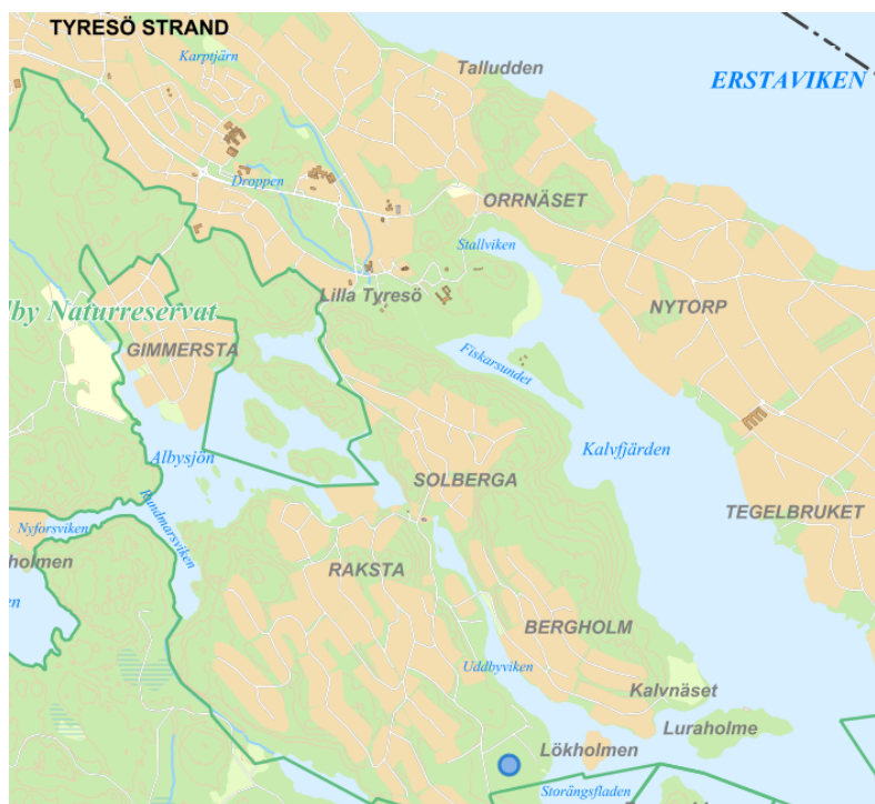
Östra Storängen vid blå punkt.