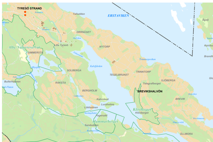
Strandallén vid röda punkter