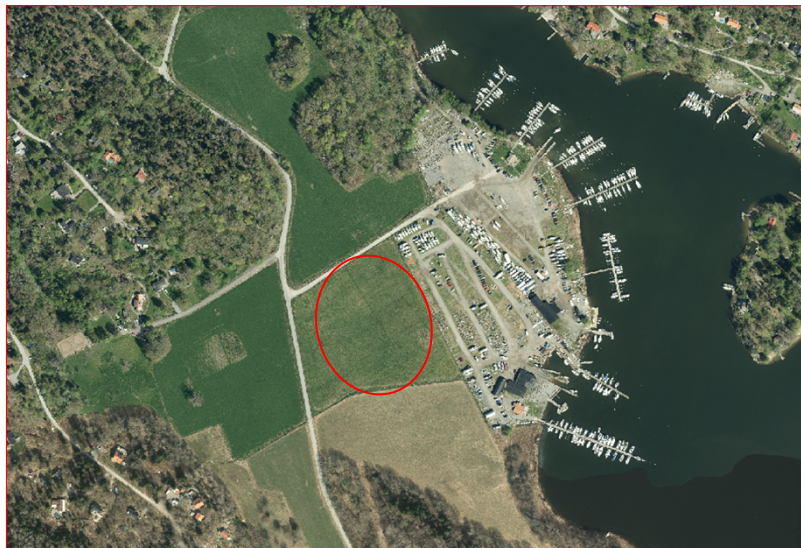
Östra Storängen. Utredningsområde inom röd markering