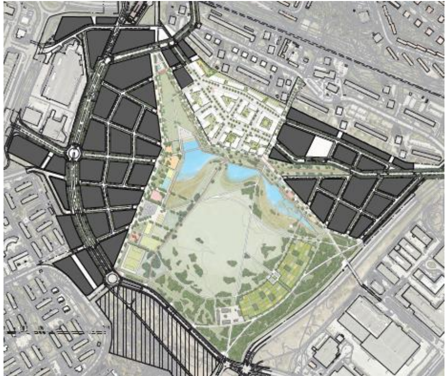
Årstafältet park i framtiden

Parken kommer att färdigställas i olika etapper. Den sista etappen beräknas bli klar cirka 2031.