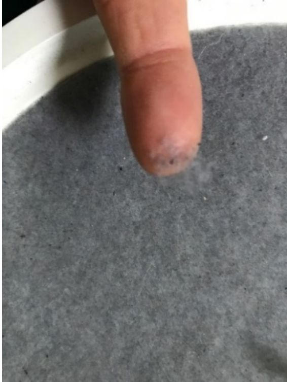
Tvätt av syntetkläder kan ge upphov till sekundär mikroplast.