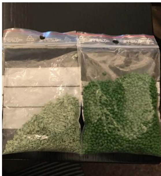
Plastpellets och gummigranulat är exempel på primär mikroplast.

Partiklarnas ursprung varierar och kategoriseras ofta som primär eller sekundär mikroplast. Primär mikroplast är avsiktligt producerade små plastpartiklar. Det kan vara plastpellets som används som råmaterial i plastindustrin eller skrubbmateriel i kosmetiska produkter, rengöringsmedel och läkemedel. Även granulat till allvädersplaner är exempel på primär mikroplast.