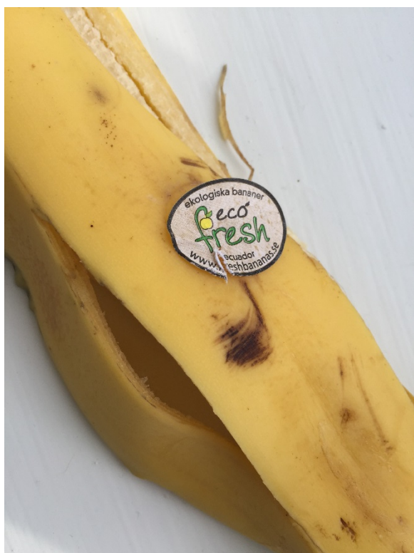
Klistermärke av plast

En sammanställning av nationella plockanalyser visar att ungefär 0,5-5 viktprocent av insamlat matavfall består av felsorterade plastförpackningar. Trots att matavfallet förbehandlas före rötning finns en risk att en del mikroplast ändå hamnar i rötresten och därmed sprids vidare till åkermark.