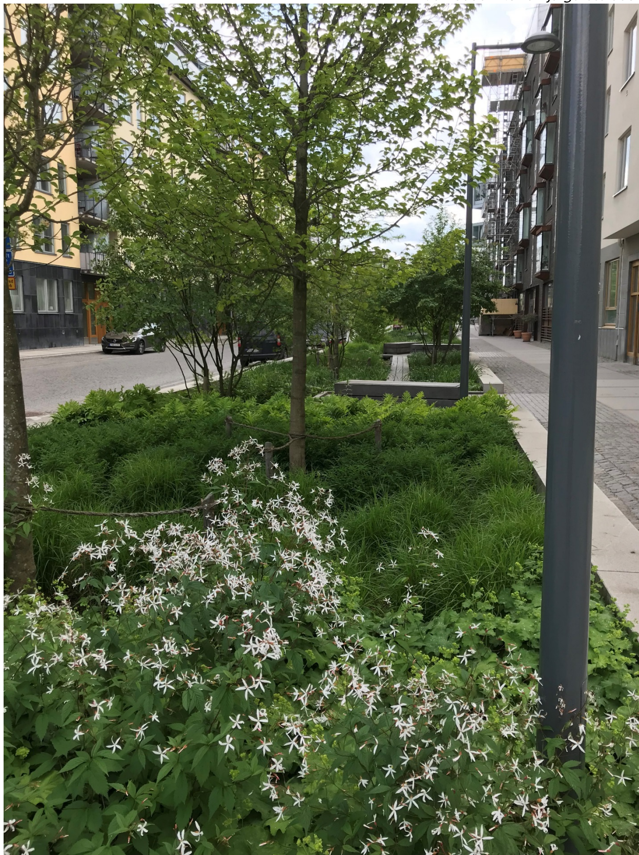
Växtbädd i Norra Djurgårdsstaden