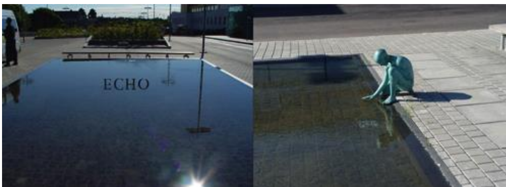
Fredrik Wretman, "Body and soul", 2002. Konstnärlig gestaltning för Södersjukhuset. Beställare: Stockholms läns landsting. Projektledning: AM Public.