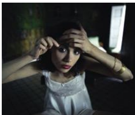
Bild 1. Ny regional utvecklingsplan (RUFs). Beställare: Stockholms Regionplanekontor och kulturförvaltningen i Stockholms läns landsting. Projektledning: AM Public. Bild 2. Shirin Neshat, ur "Zarin", Stockholm konst vid GATE – Greenland Park Art and Technology event i Kista. Beställare: Stockholms stad m.fl. Projektledning: AM Public.