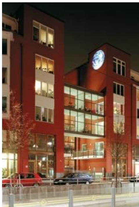
Bild 1. Ulf Rollof, "Rosa/Turquoise och 3 Blå", Konstnärlig gestaltning för Kv. Riga 2 i Värtahamnen, Stockholm. Beställare: Vasakronan. Projektledning: AM Public. Bild 2. Eva Koch, "Spænd", Konstnärlig gestaltning för Båtbyggargatan i Hammarby sjöstad, Stockholm. Beställare: Familjebostäder. Projektledning: AM Public.