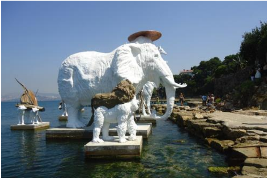
Adrián Villar Rojas, "The most beautiful of all mothers", Istanbul Biennial, 2015.

Konst och kultur har en bärande betydelse i samhällsbyggandet då den har förmågan att placera människan i centrum och påverkar betraktaren på olika sätt, bland annat emotionellt, rumsligt, fysiskt, sinnligt och intellektuellt. Konsten har kapacitet att tala till det personliga och allmänmänskliga i oss och skapa rum för förståelse och acceptans för andra människor. Den ger oss alternativ att förnimma och gestalta världen och uttrycker känslor som inte alltid kan uttryckas i ord. Konsten är betydelsefull för vår självkänsla och identitetsbildning och därmed för människan som kulturvarelse.