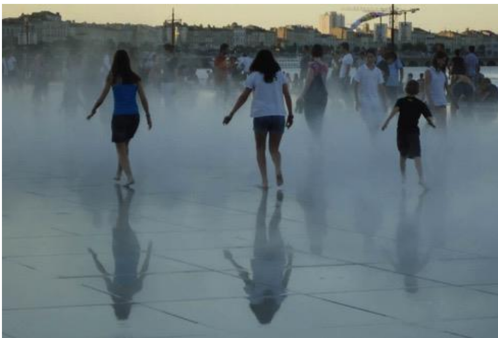
"Mirror d'Eau (Mirror of Water)", Bordeaux, France.