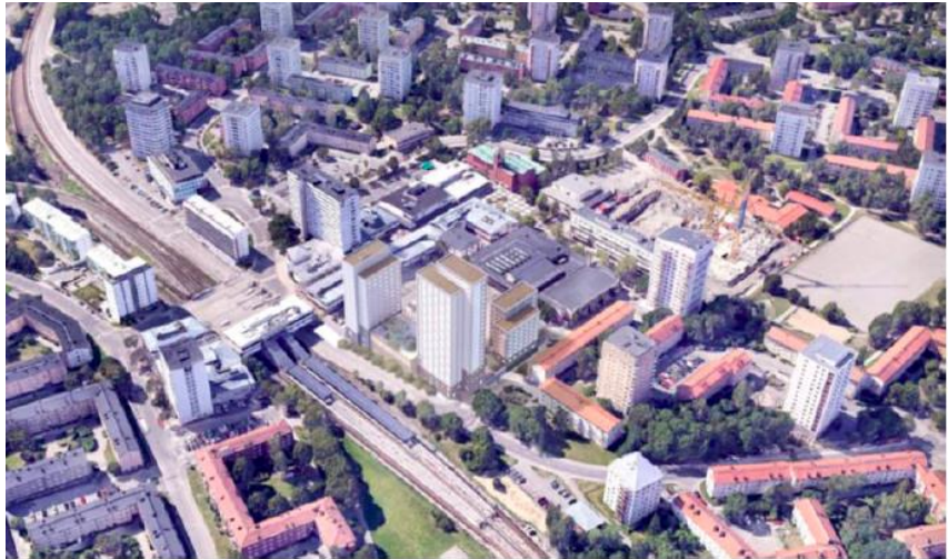
Figur 4: fotomontage med byggnaderna inplacerade, vy från nordöst, källa: detaljplan för samrådshandling.