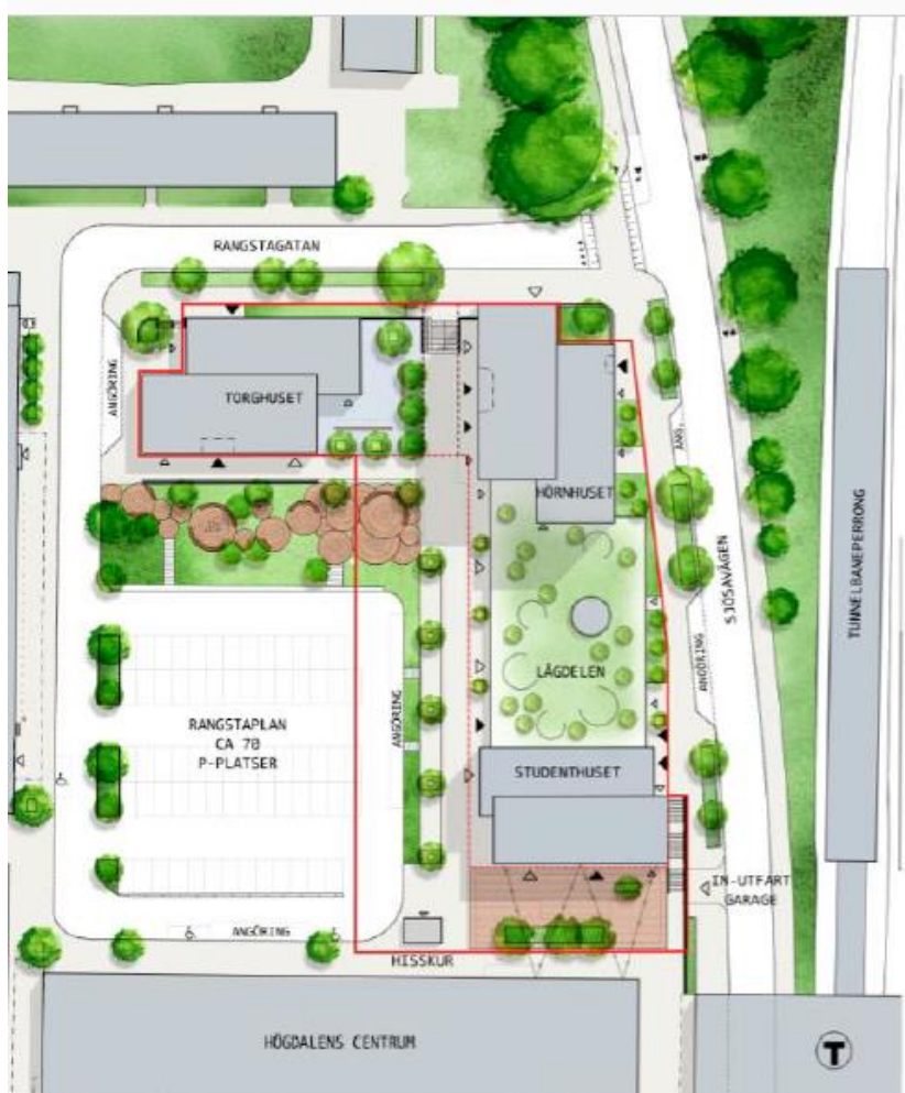
Figur 2: illustrationsplan med planområdes gräns inom heldragen röd linje.

norra delen av Rangstaplan utmed Rangstagatan placeras ett 10 våningar högt hus, torghuset, med cirka 55 hyreslägenheter.