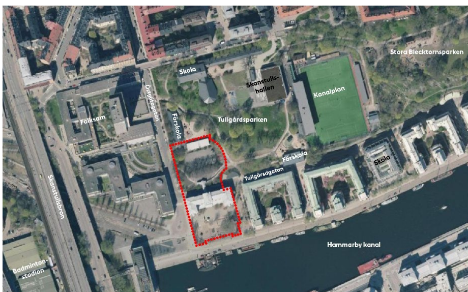
Bild 1: Flygfoto över Tullgårdsskolan idag med planområdet markerat i rött

Tullgårdsskolan ligger i kvarteret Tullstugan inom den befintliga detaljplanen dp 8526 som medger tillbyggnad på i huvudsak tre ställen: i en fristående byggnad norr om Tullgårdsgatan med max två våningar samt att respektive flygel på befintlig byggnad förlängs. Planen tillåter också en tvärförbindelse mellan flyglarna samt en uppglasad mittdel.