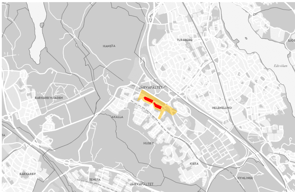
Kartan visar projektet Saima/Kotka (i rött) och detaljplaneområdet (i gult).

Projektområdet ligger på 4 minuters gångavstånd från Akalla centrum och tunnelbanan, som når T-centralen på 26 minuter. När Förbifart Stockholm färdigställs förbättras Akallas strategiska läge för fordonstrafik genom tvärförbindelser norrut och söderut. Den pågående förlängningen av tunnelbanans blåa linje kommer dessutom förbättra kopplingen till Barkarbystaden och Barkarby Handelsplats. En kort promenad ifrån projektområdet ligger Järvafältets naturreservat med goda rekreativsmöjligheter.