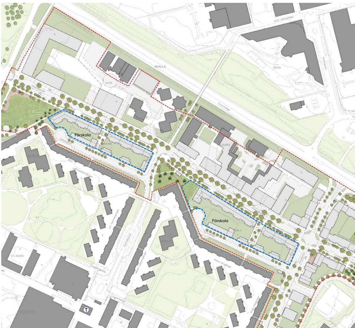
Situationsplan för del av detaljplanen med nya byggnader i ljusgrått och befintliga i mörkgrått. Gräns för detaljplanen med rött streck och Svenska Bostäders kvarter med blått. Förskolorna inom Saima och Kotka placeras i skyddat gårdsläge längs Kotkagatan och Saimagatan.

Projektet omfattar ca 380 lägenheter fördelade på två kvarter med lokaler i utvalda bottenvåningar. Lägenhetsantalet kan komma att ändras i samband med framtida projekteringsarbete. Fokus har varit att bidra till omvandlingen av Finlandsgatan och att skapa så bra boendekvaliteter som möjligt. Mot Finlandsgatan skapas därför en stadsmässig fasad som samtidigt skärmar av trafikbullret och mot lokalgatorna i söder, Saimagatan respektive Kotkagatan, en öppen och lägre kvarterstruktur som tillåter solen att röra sig genom gårdsrummen och bidra till goda dagsljusförhållanden. Genom varje kvarter går ett allmänt gångstråk som kopplar samman det befintliga Akalla med Finlandsgatan.