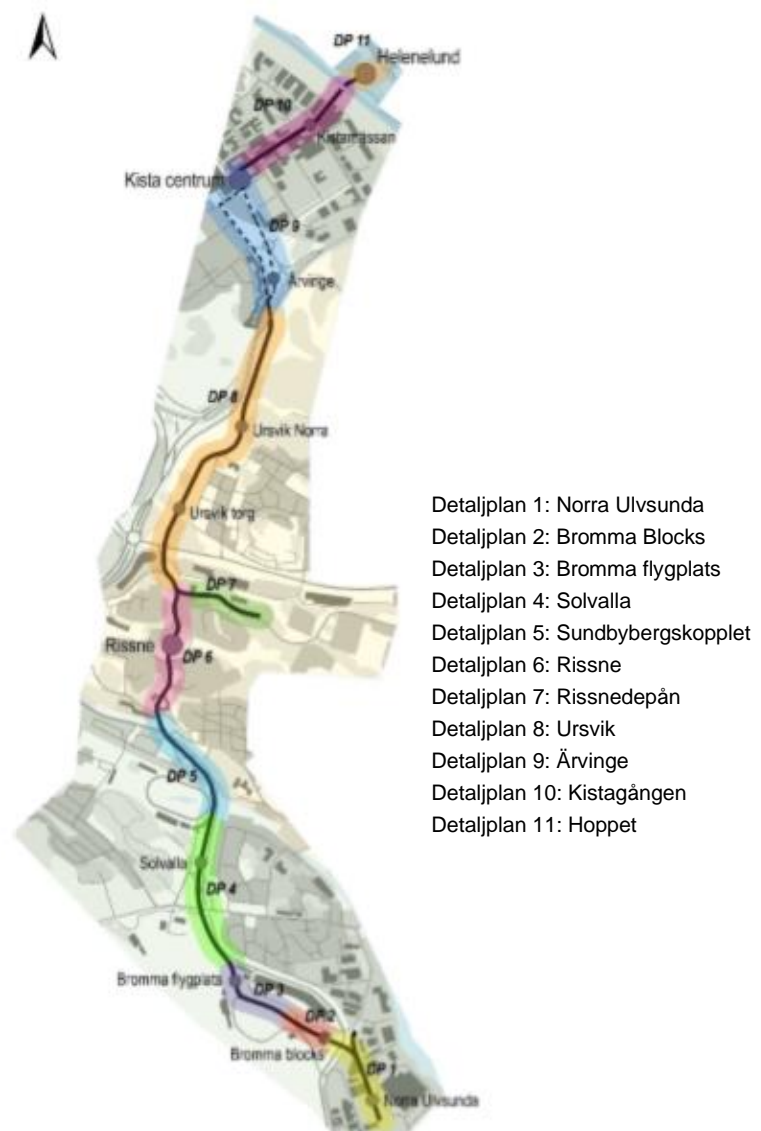
Bild 1. Kistagrenens detaljplaneindelning i Stockholm, Sundbyberg och Sollentuna

Detaljplanen för Kistagrenen var på samråd 2015. Efter samrådet delades detaljplanen in i sju detaljplaner inom Stockholms stad.