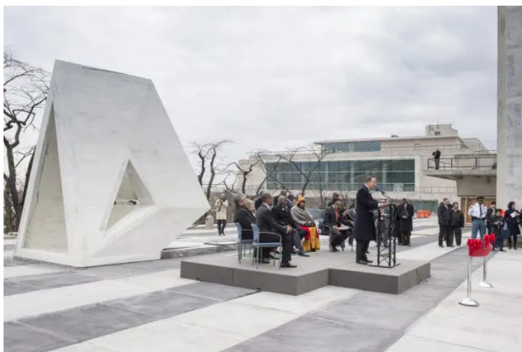
Minnesplats för slaveriets offer

Som en följd av kolonialiseringen i Nord- och Sydafrika blev slaveri accepterat i europeiska samhället. Européerna använde olika utseende och kultur till att rättfärdiga slavhandel. Rasism var alltså inte orsaken, men användes som en ursäkt för att delta i och utvidga slavhandeln till den grad att många faktiskt trodde att afrikaner var mindre värda än européer. Rasism blev därmed en integrerad del, inte bara av slavhandeln, men också i kolonisamhället som helhet.