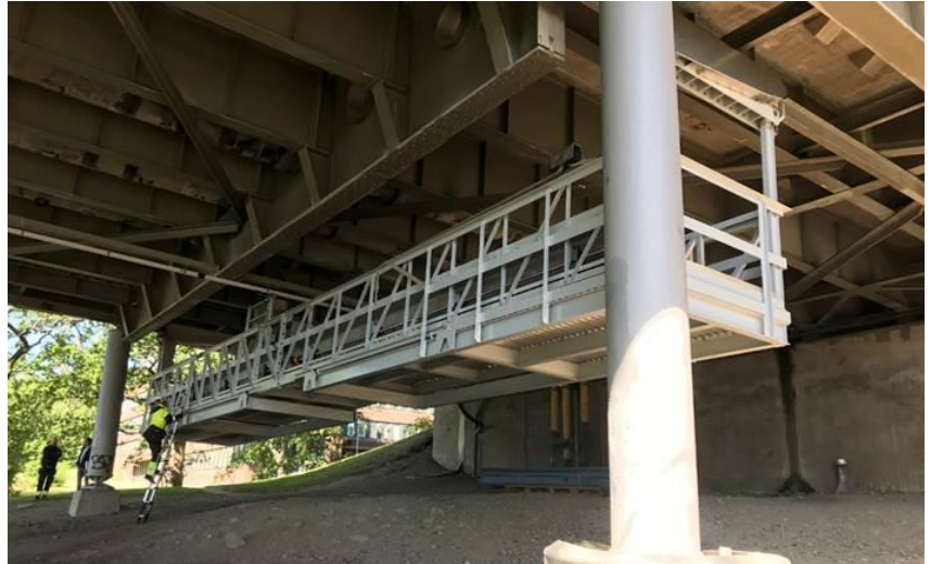
Bild 2- Nya inspektionsvagnar

Tätskiktsbyte och betongreparationer 3 broar i Sättra Projekt för renovering av tre broar i Sättra utfördes under 2018- 2019. Broarna var lokaliserade i korsningen Eksättravägen- Kungssättravägen och en längre söderut på Eksättravägen, se Bild 3. Projekten fick namnen: