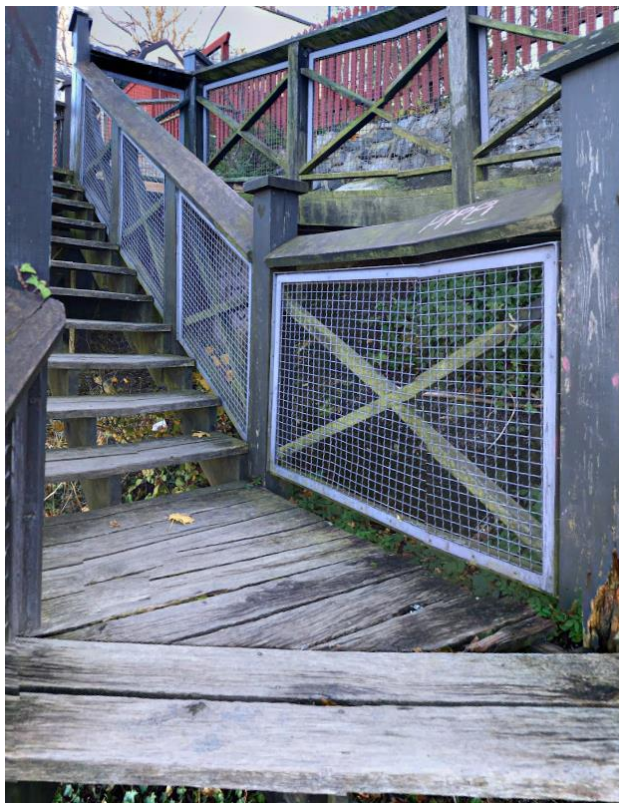
Bild 9- Monteliustrappan före renovering