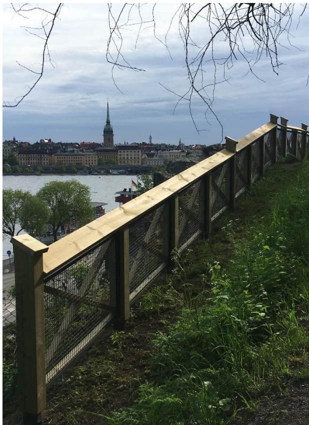
Bild 11- Renoverat räcke