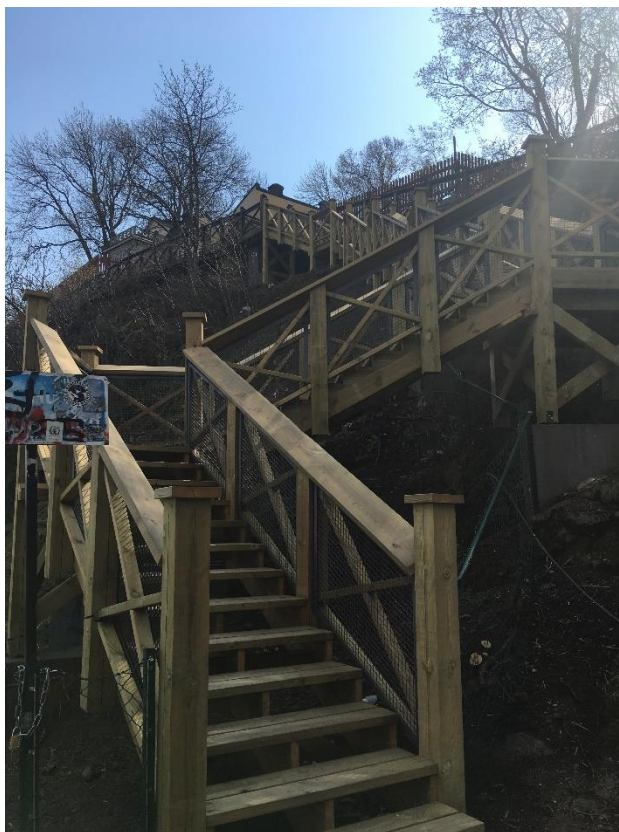
Bild 10- Trappan i färdigrenoverat skick