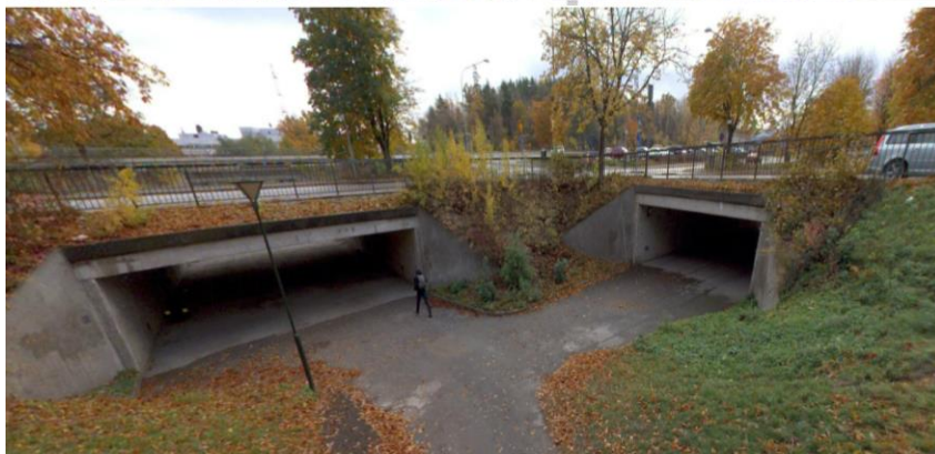
Bild 4- Broarna i korsningen Eksättravägen-Kungssättravägen