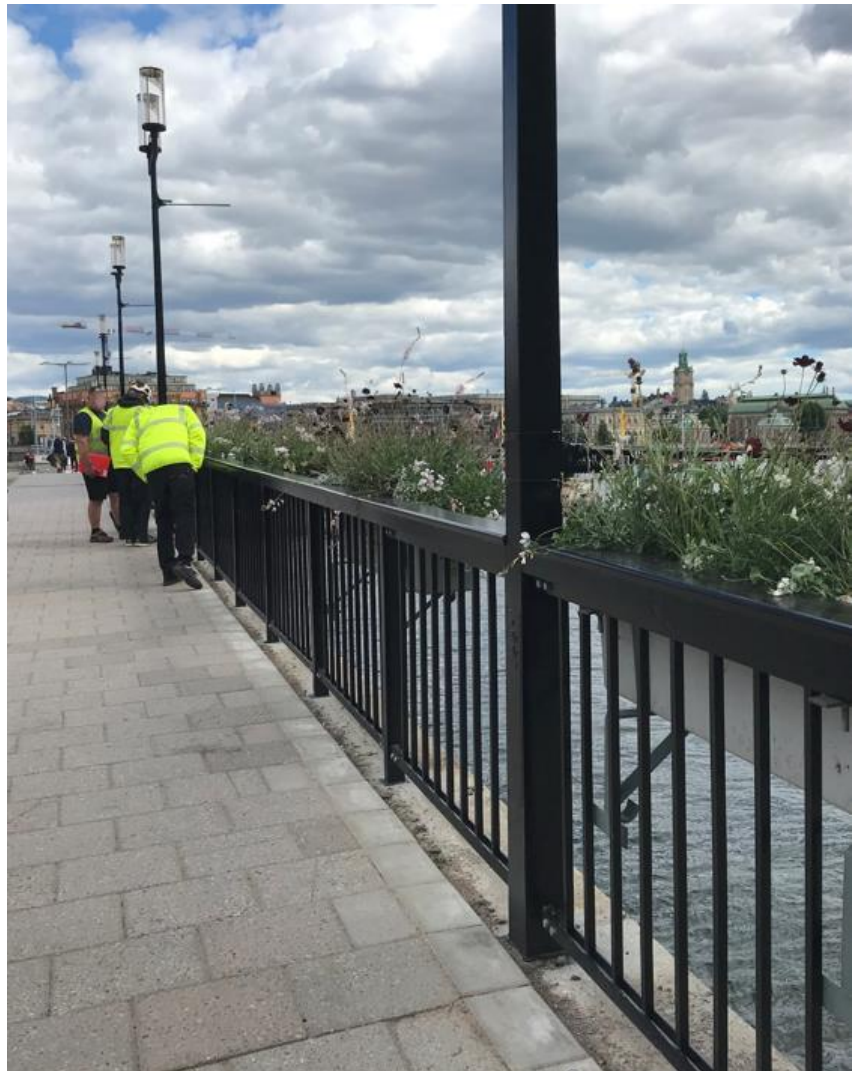
Bild 8 - Räckets efter ommålning av räcke, se speciellt svart armatur på svart stolpe