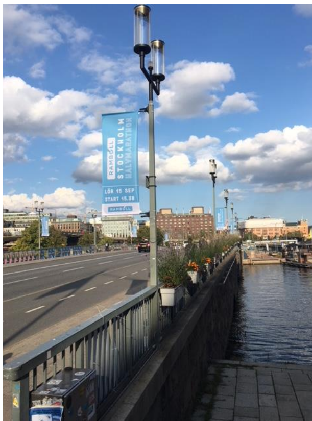
Bild 5- Räcket före ommålning av räcke, se speciellt svart armatur på grå stolpe

Projektet utfördes under 2019 och kostade totalt 2,3 mnkr.