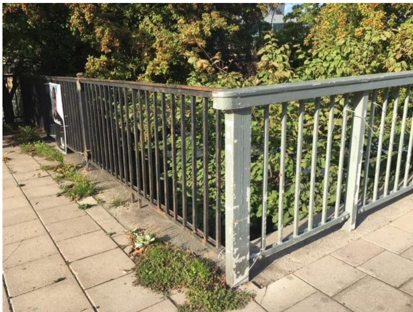
Bild 6- Detaljbild på räcket innan ommålning