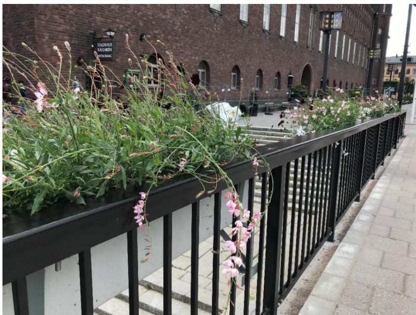
Bild 7- Detaljbild på räcket efter ommålning