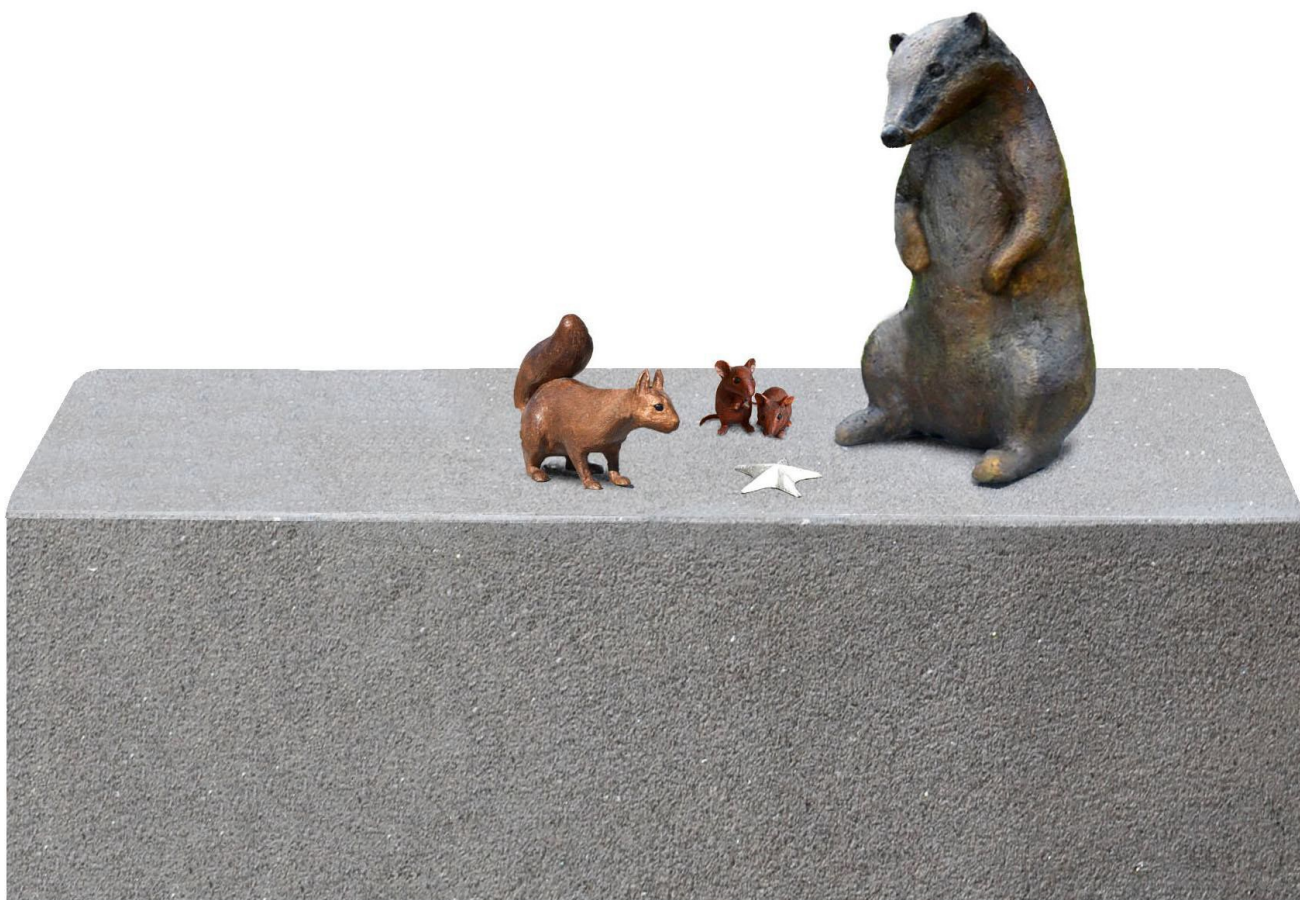
”Förundran” - skulpturgrupp i brons och granit av Eva Fornåå.

Sockeln är 130 cm lång och djuren är i naturlig storlek.