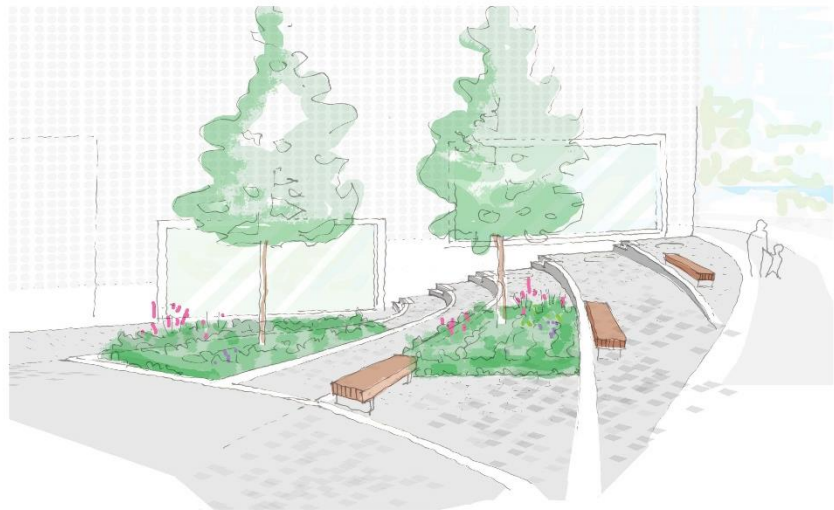
Illustration över torget.